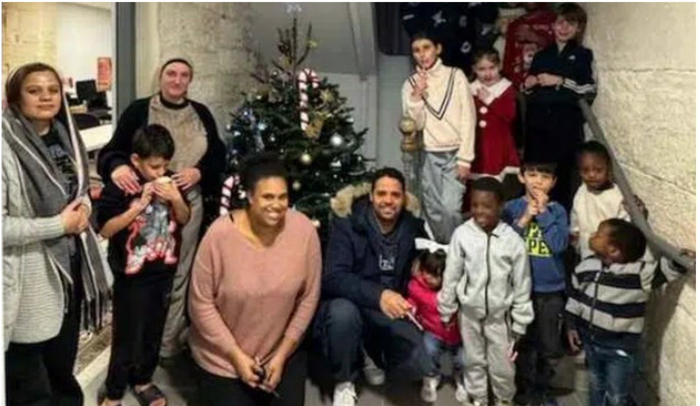
Noël 2024 à la résidence des Remparts à Avignon

Association située à Avignon, Habitat et Humanisme Vaucluse a été créée en 2015. Forte de ses 54 bénévoles et 5 salariées, elle dispose d'une cinquantaine de logements acquis en propre ou confiés par des propriétaires solidaires, afin de loger les personnes en difficulté. La structure gère et anime un habitat collectif destinés à des personnes d'âges variés, toutes isolées et avec de faibles ressources. Un des logements est réservé à des femmes victimes de violence conjugale. En 2025, elle a plusieurs d'habitats collectifs à Orange, Entraigues-sur-la-Sorgue et Carpentras.