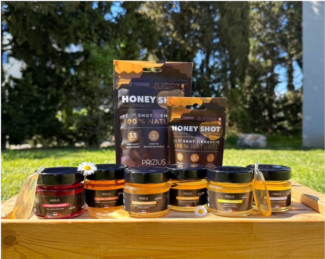
Les miels et capsules HoneyShot.