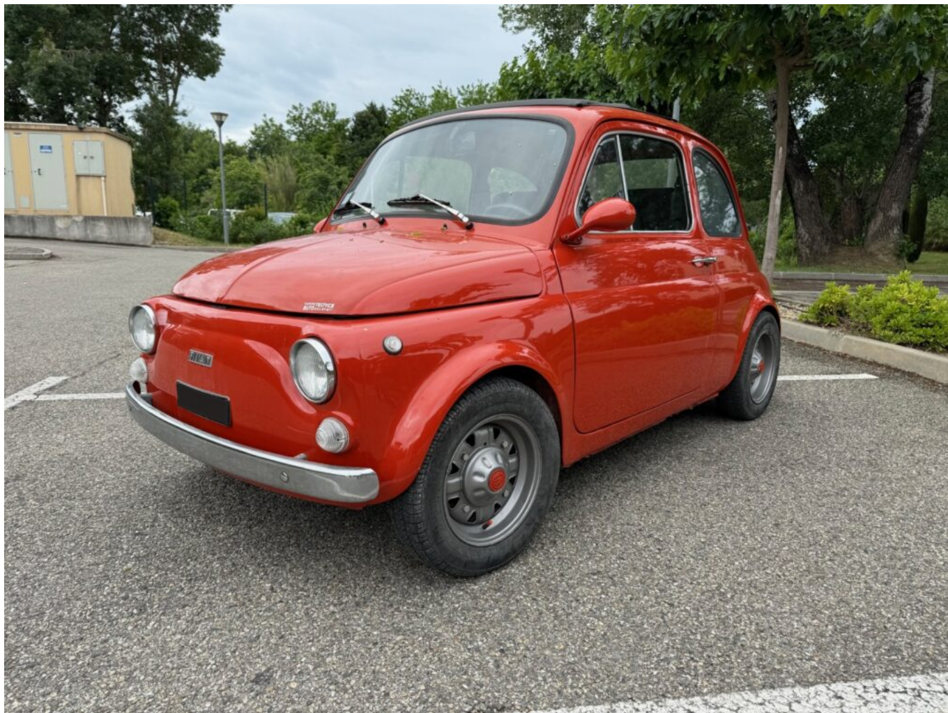
Fiat 500 (1973)