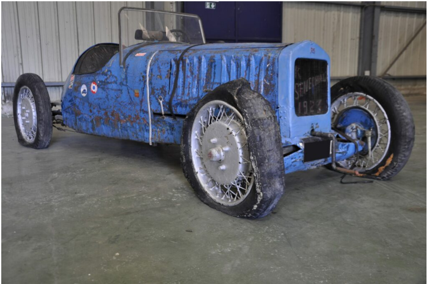
Senechal type SS2 (1924)