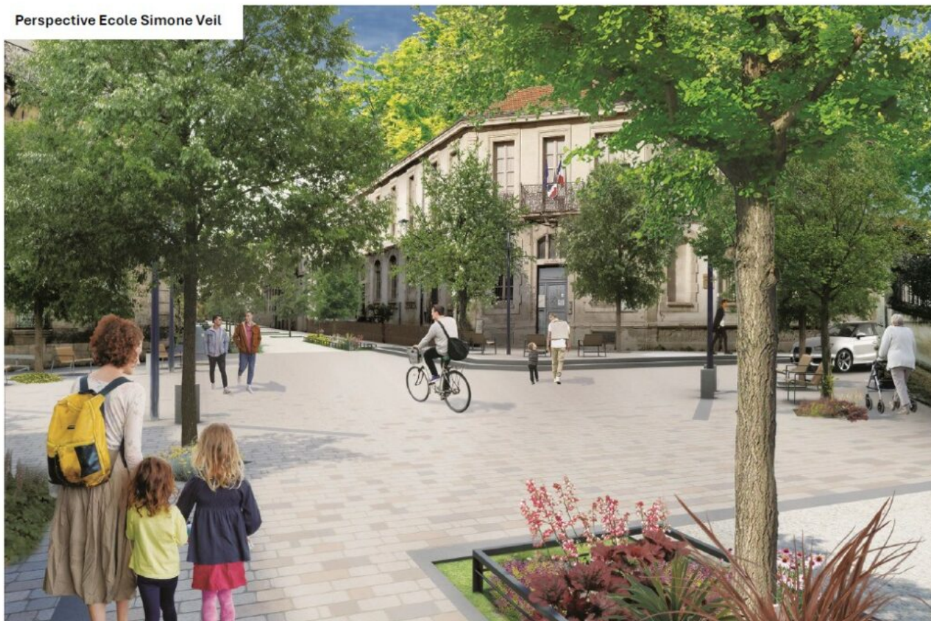
Perspective Ecole Simone Veil

Le parvis de l'école Simone Veil (ex école Thiers) bénéficiera de la requalification de la rue Thiers