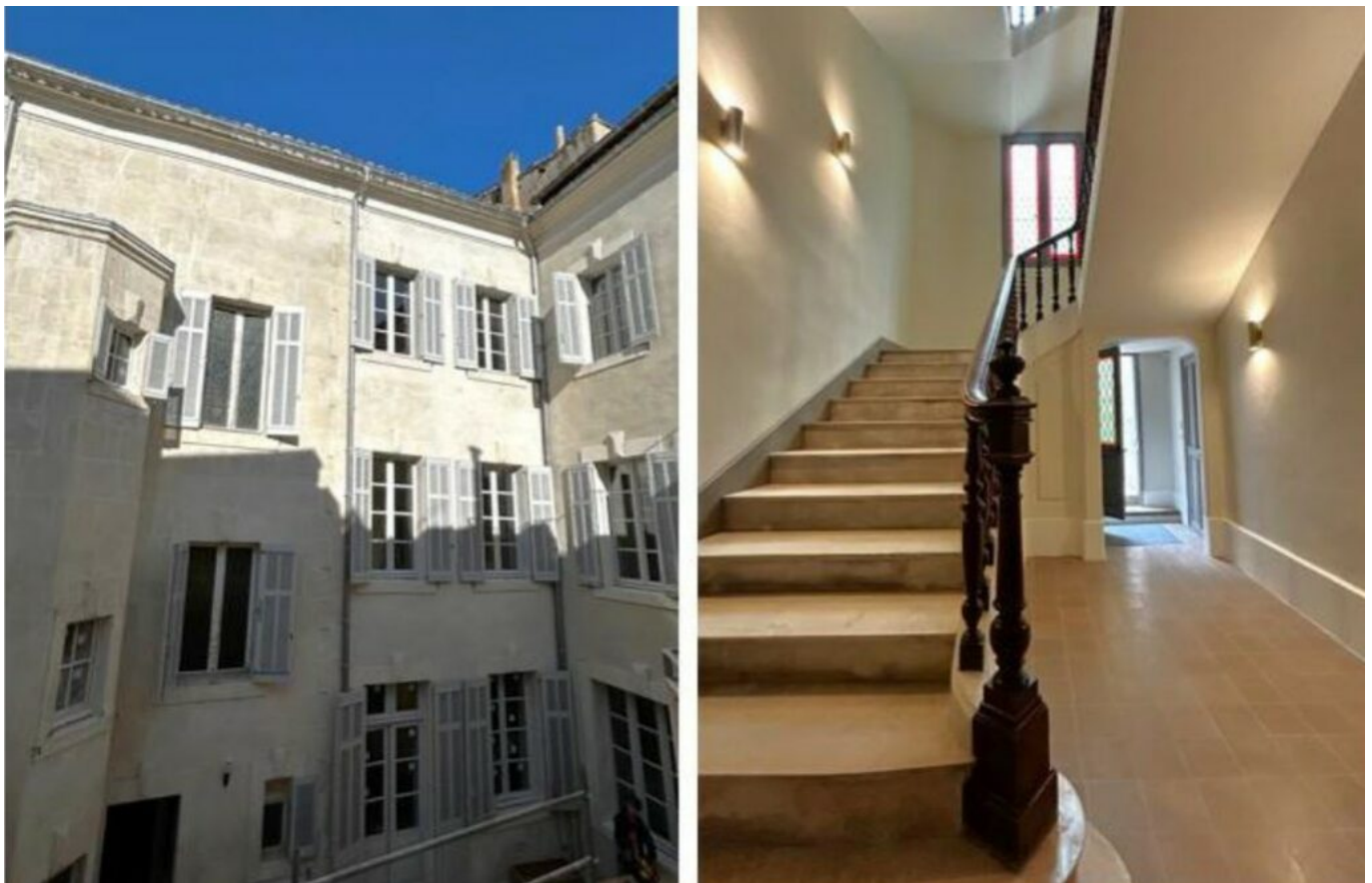
Réhabilitation 6, rue du Roi René à Avignon