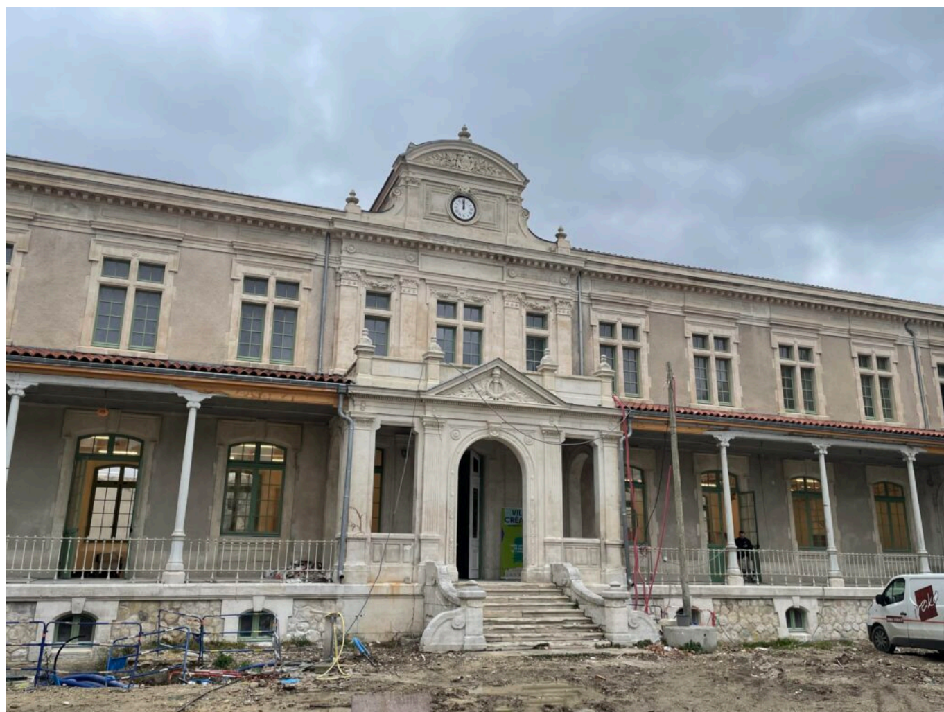
La Villa créative durant sa réhabilitation

Avignon Université est déjà en train de dupliquer l'expérience à Agroparc avec la Villa Naturalité - Avignon Université adossée à la Faculté des sciences et dont l'ouverture est prévue fin 2027. La Villa créative sera inaugurée le 26 mai prochain. La réception des travaux devrait avoir lieu fin mars. Le Frames Web Video Festival devrait y être accueilli pour un temps fort du 23 au 26 avril prochains. Avignon Université prévoit une fréquentation du site de 2 000 à 2 500 personnes/jour lors du festival, 1 000 au beau temps, 600 en basse saison.