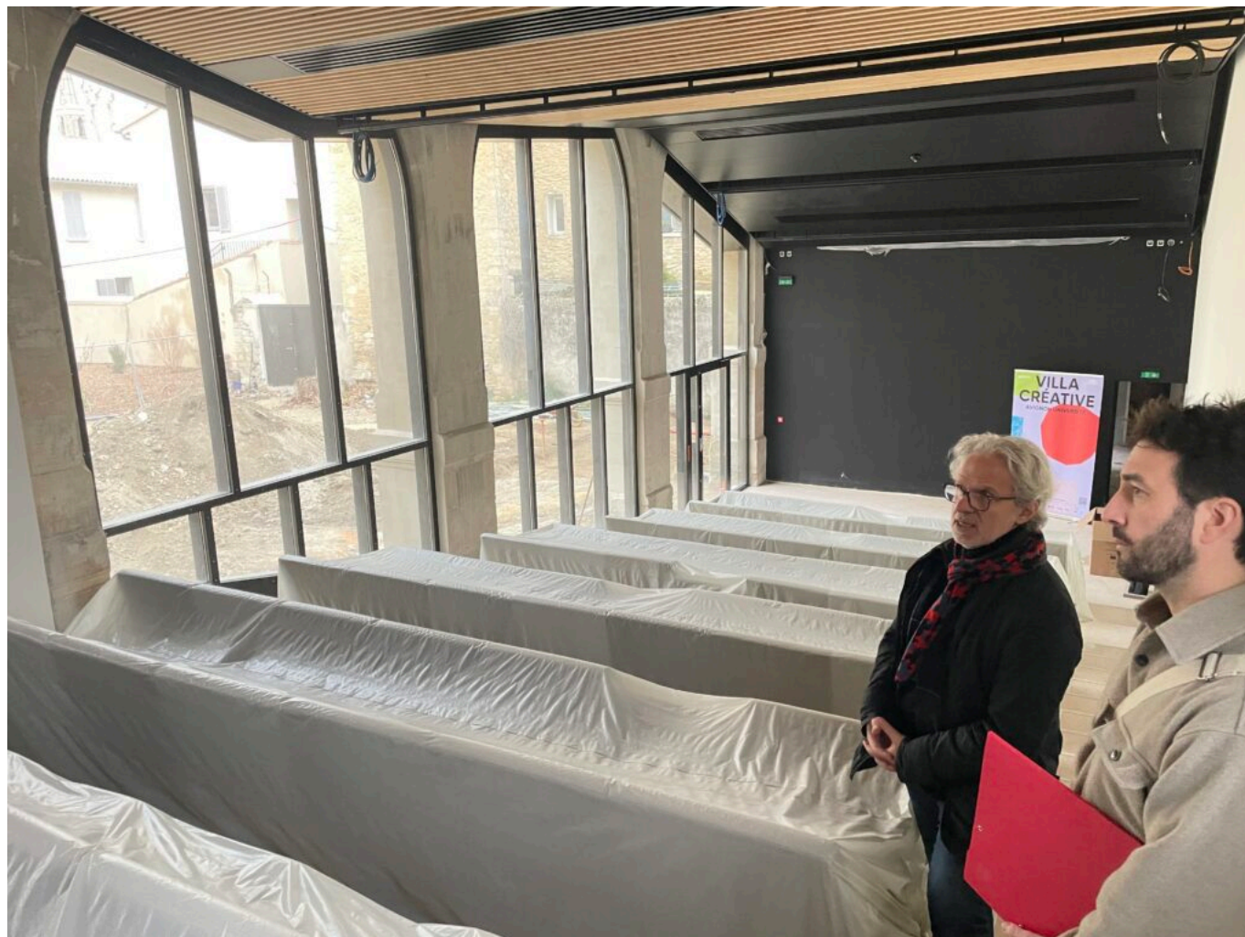
L'auditorium présenté par l'architecte Alfonso Femia et DLLA Architectes

de la Recherche, de la Banque des territoires, de la Banque Populaire Méditerranée et de la SAS Villa Immo SUR, pour obtenir un budget de 18,9M€ nécessaire à la dépollution et la réhabilitation complète du site. En plus de l'édifice patrimonial, l'Université d'Avignon a choisi d'intégrer un deuxième site. Rénové à hauteur de 700 000€ avec le soutien du programme France Relance, ce bâtiment est situé à 300 m du site principal. Inauguré en juillet 2023, le Pavillon des Arts et Métiers est désormais le lieu d'implantation du Cnam -Conservatoire des arts et métiers- en Vaucluse.