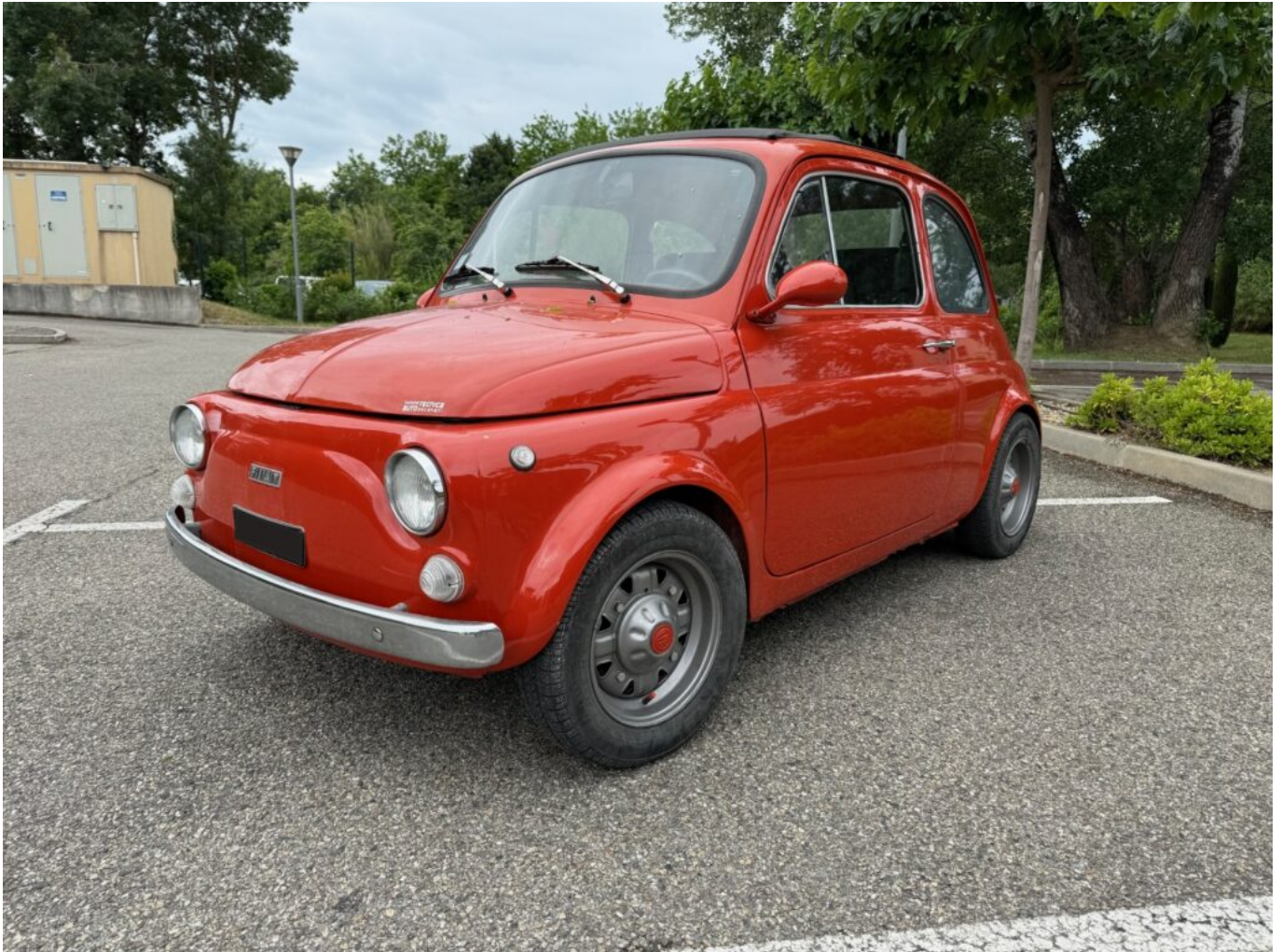
Fiat 500 (1973)