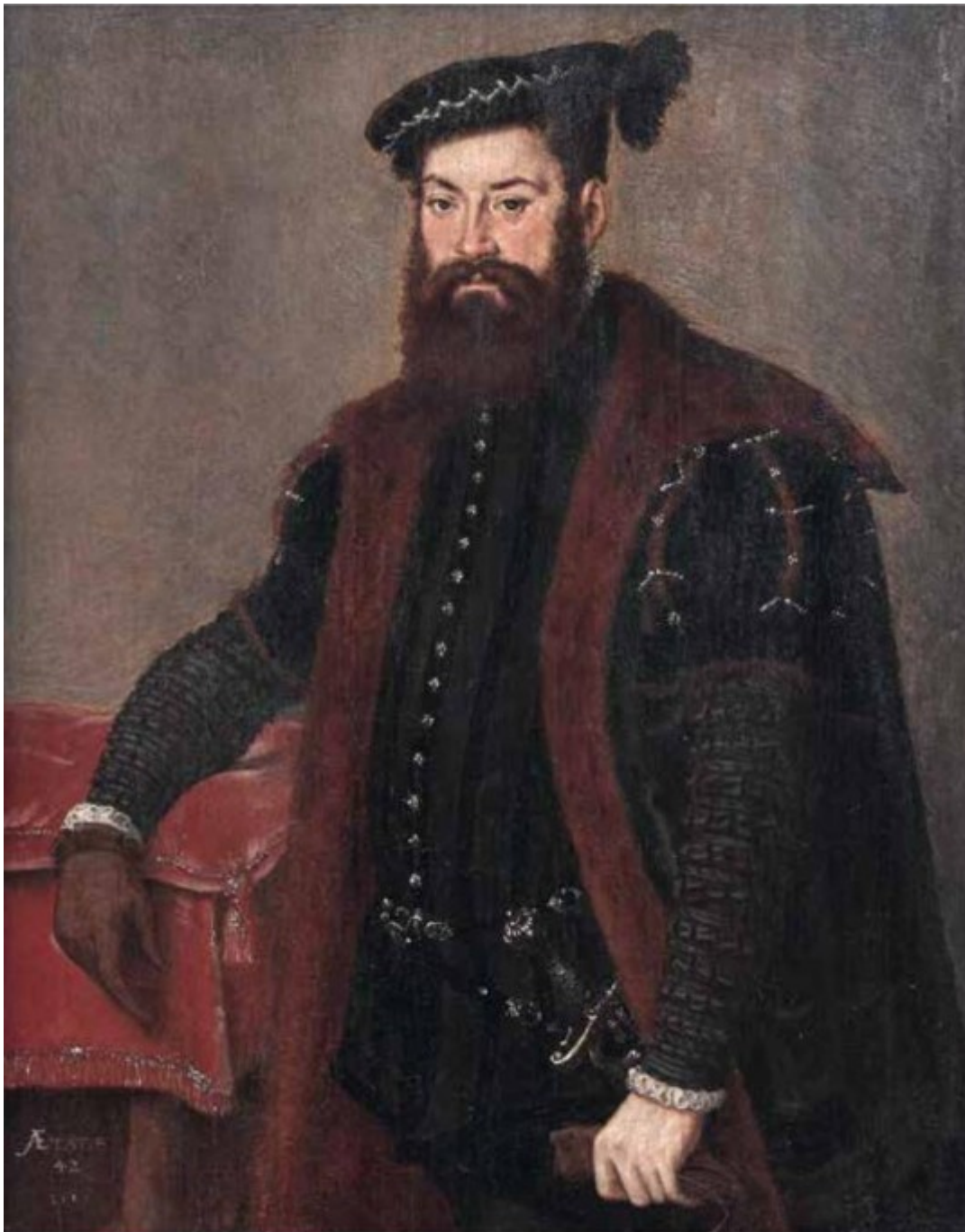
ATTRIBUÉ À HANS EWORTH (1520-1573) : Portrait présumé d'Edward Seymour.