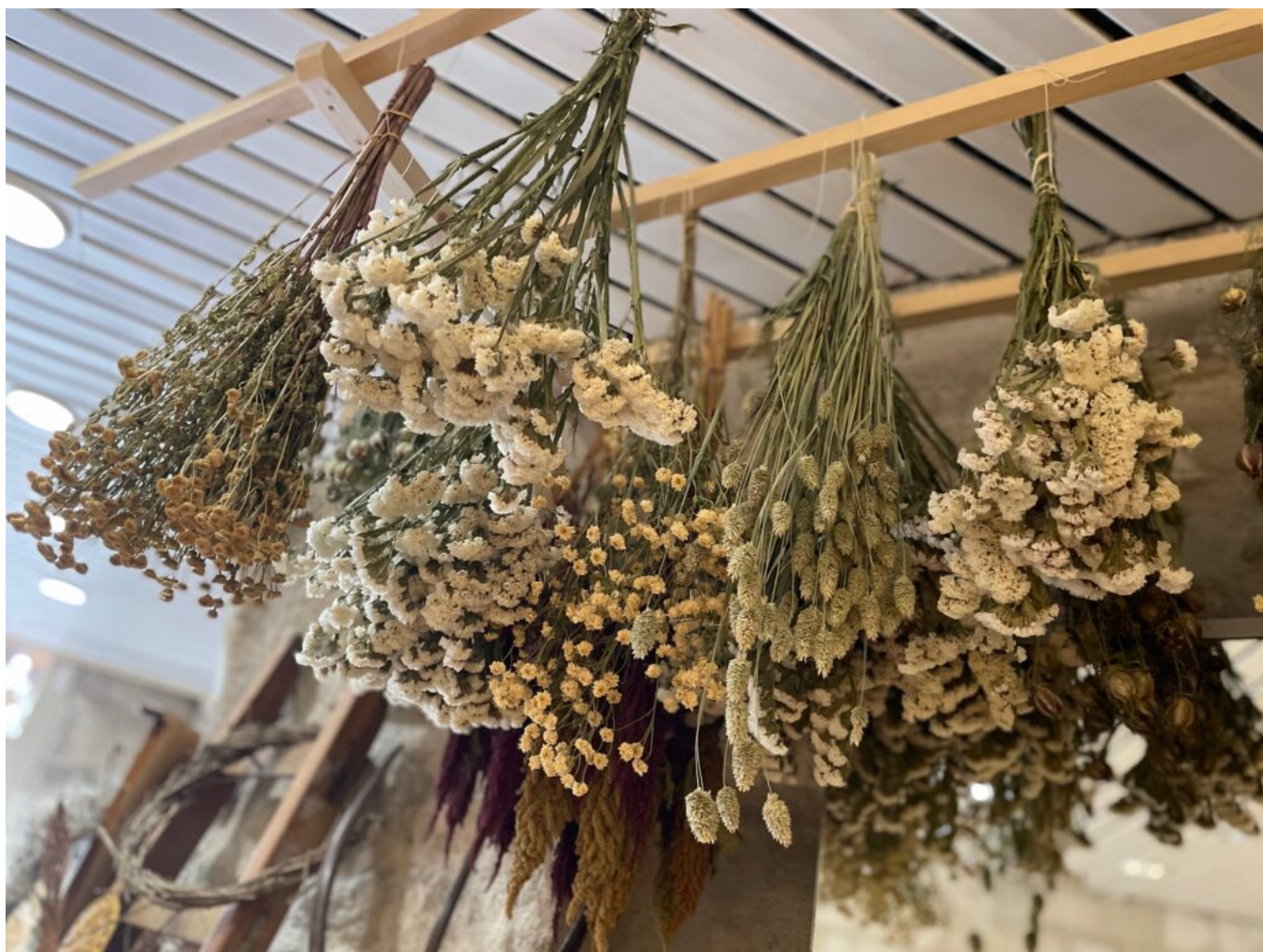
Les fleurs séchées de Lara Hollebecq