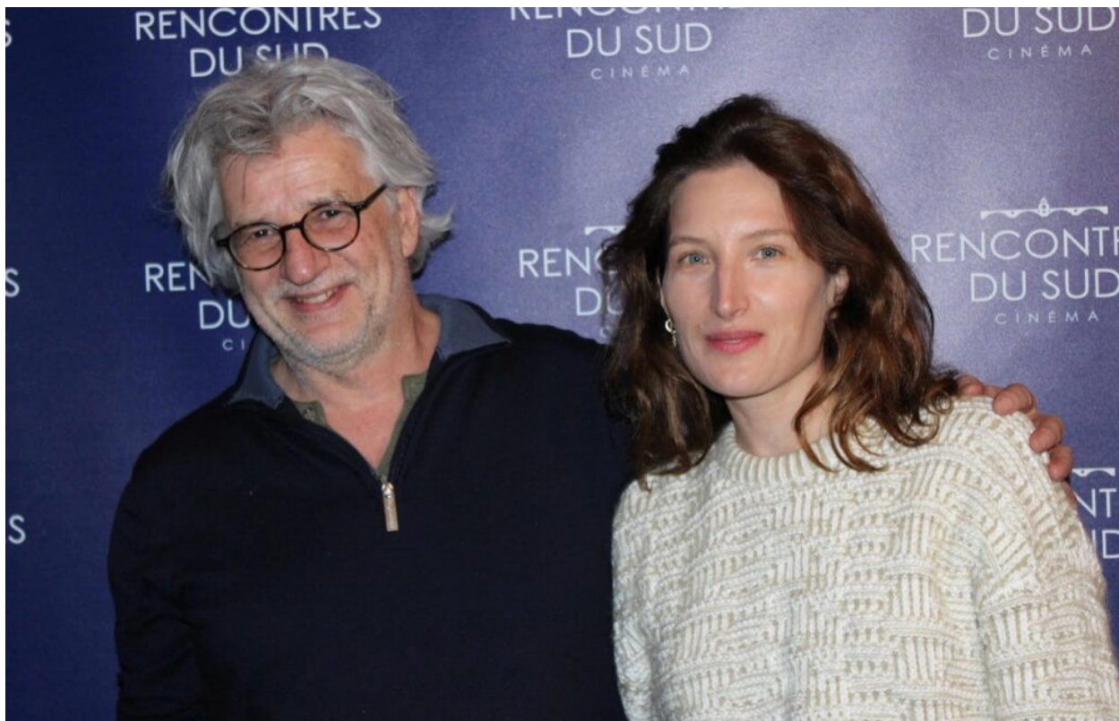
Michel Leclerc et Julia Piaton.

Ce film a valu à Benjamin Lavernhe le prix d'interprétation masculine dans le festival international de comédie de l'Alpe d'Huez 2025.