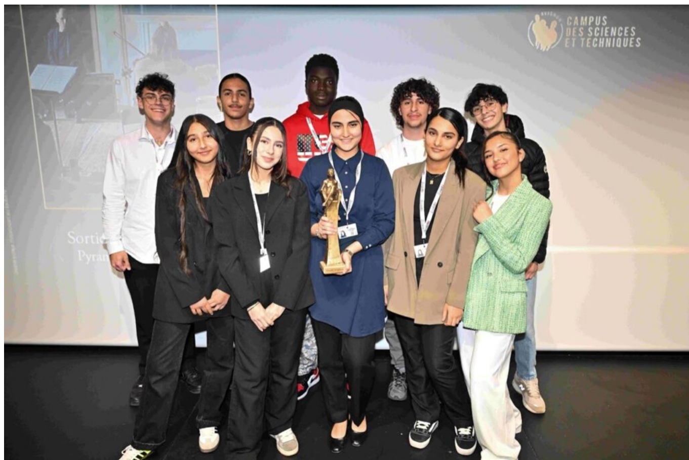
Le film Les Musiciens a remporté le prix des lycéens du Campus d'Avignon.