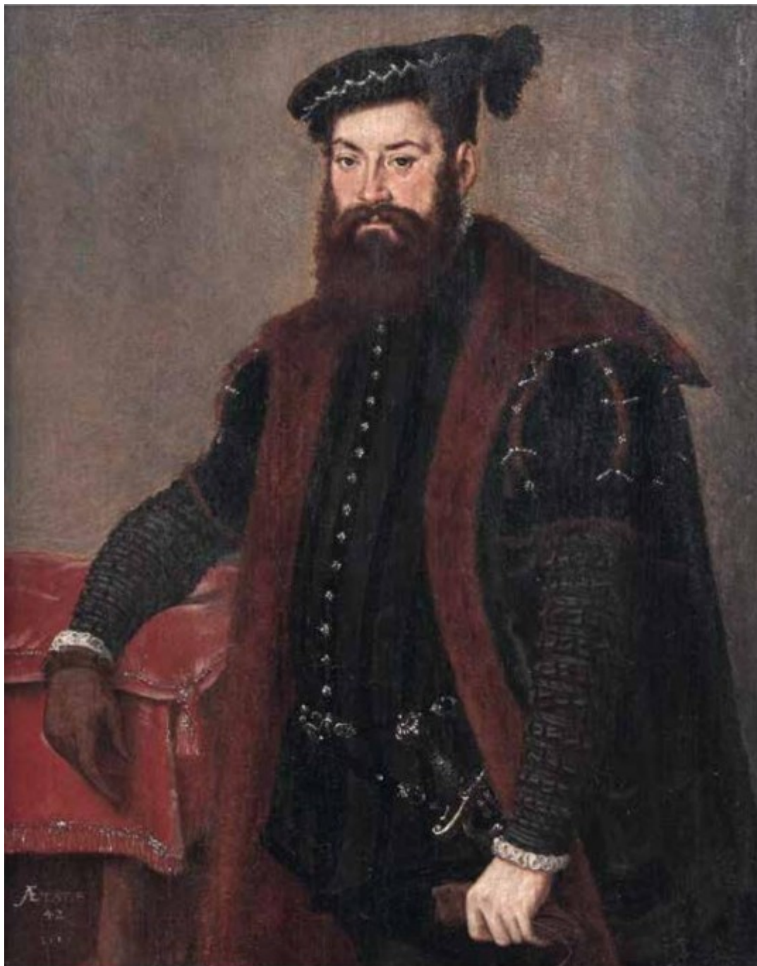
ATTRIBUÉ À HANS EWORTH (1520-1573) : Portrait présumé d'Edward Seymour.