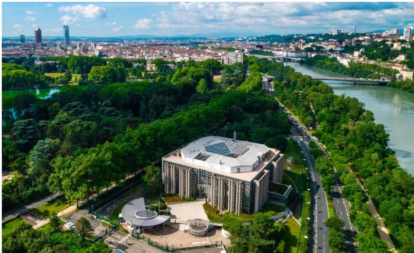
Le siège d'Interpol à Lyon.

Interpol, cette police internationale d'élite, dispose d'une base de données tous azimuts de 12 millions de photos, vidéo, empreintes digitales et numériques, échantillons d'ADN et ses agents d'un réseau mondial d'informations cryptées qui leur permet d'échanger en toute sécurité 24h/24 pour la protection et la sécurité de tous.