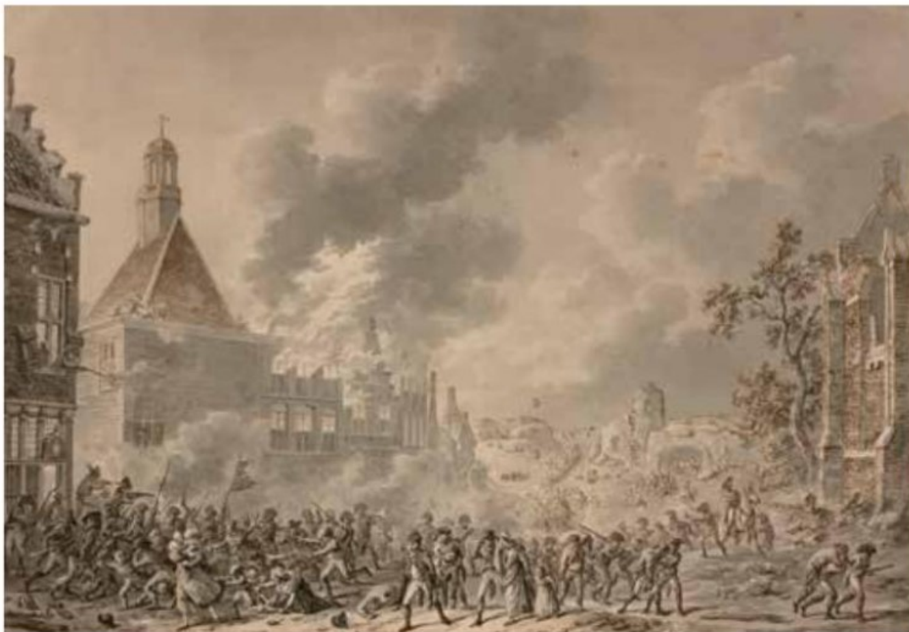
Scène de pillage et d'incendie de Dirk Langendyk Copyright Hôtel des ventes d'Avignon