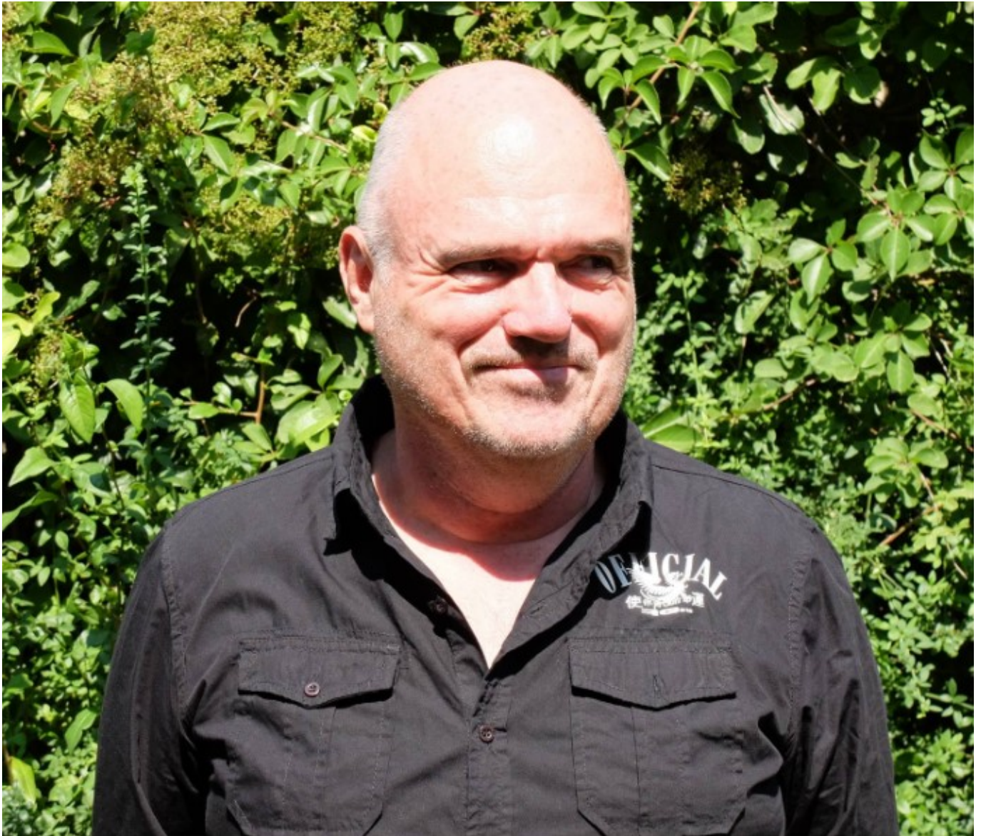
Bernard le Corff Copyright AF&C