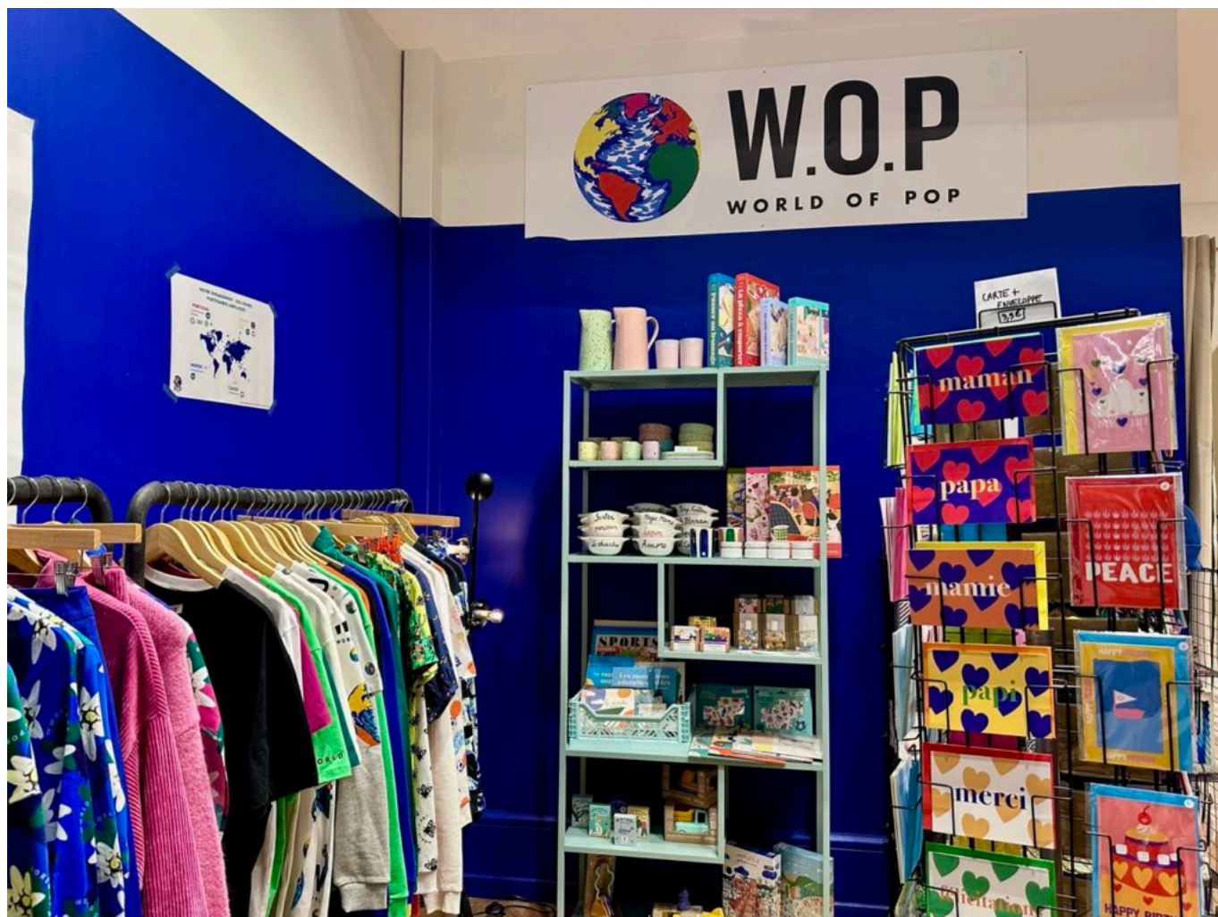
Un coin du pop-up store avignonnais.