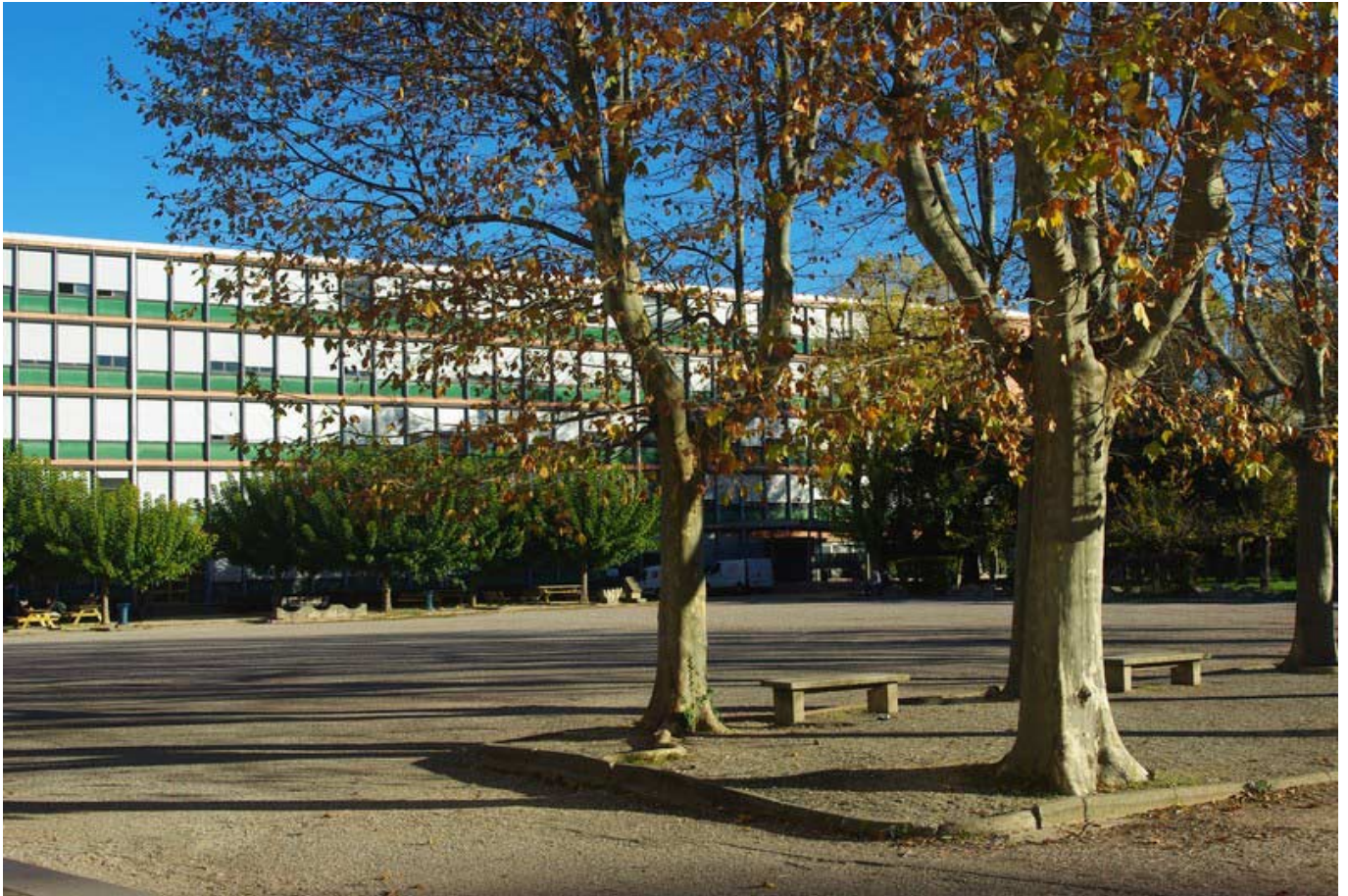
Le lycée Philippe de Girard à Avignon.