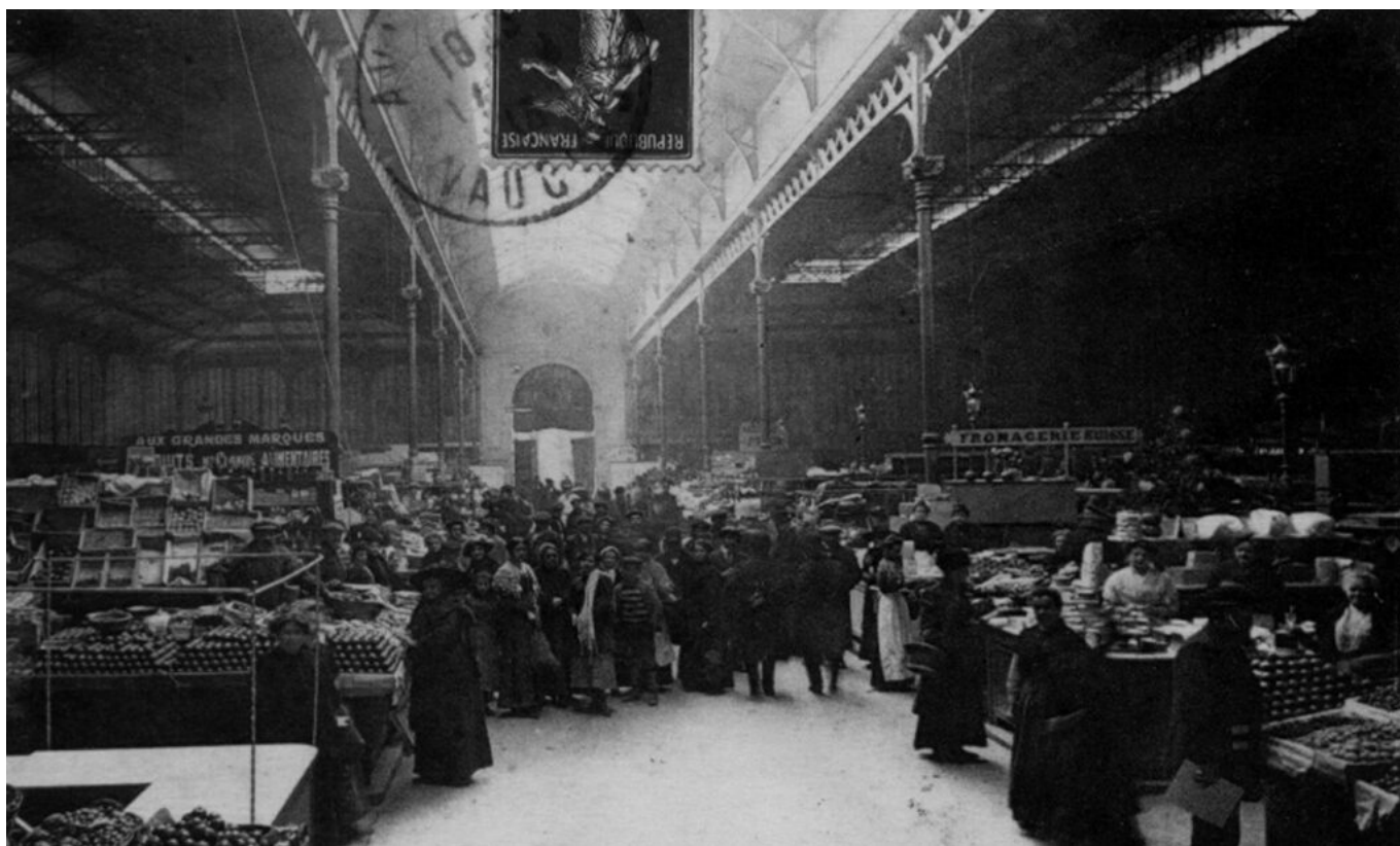
Intérieur des Halles. Collection Bayard. B.B Imprimerie. 9×14