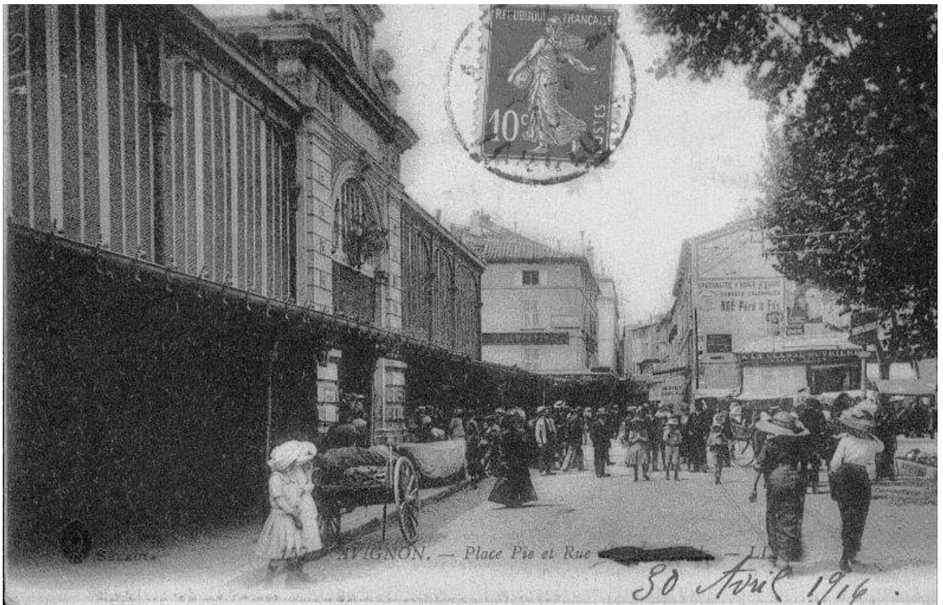
Les Halles en 1914.