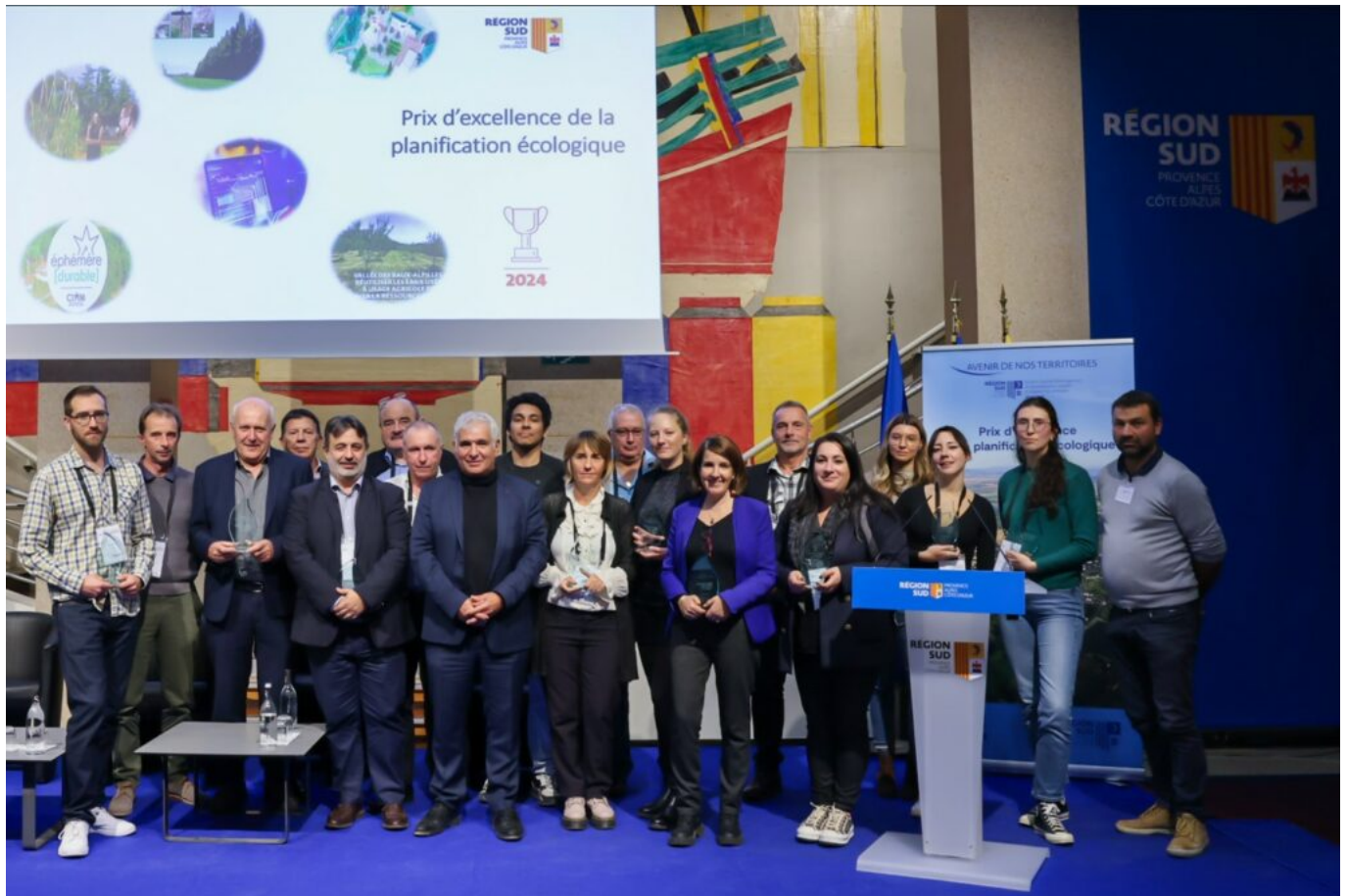
L'ensemble des lauréats de la 2 e édition du Prix d'excellence de la planification écologique de la Région Sud.

*Les autres lauréats sont la société niçoise Qualiteo, Insite dans la catégorie 'lycéens et jeunes', l'Université de Toulon et la Communauté de communes Vallée des Baux-Alpilles dans la catégorie 'collectivités locales' et centre international des arts du mouvement dans la catégorie 'associations'.