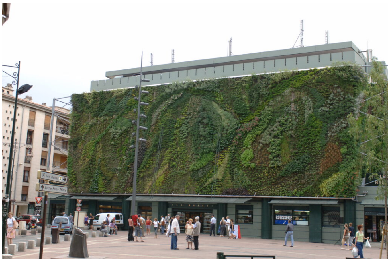
Inauguration du mur végétal des halles le 17 juin 2006.