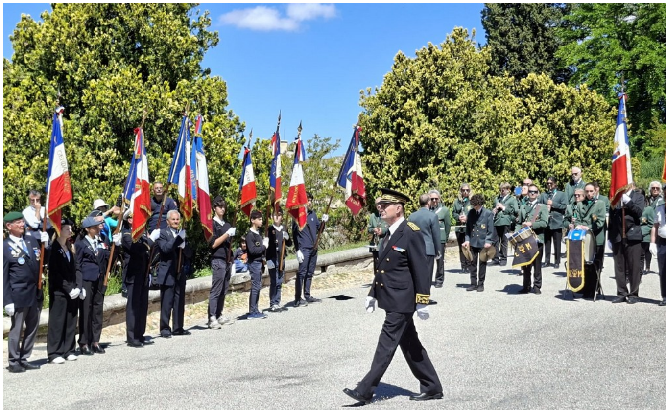
Le préfet de Vaucluse.