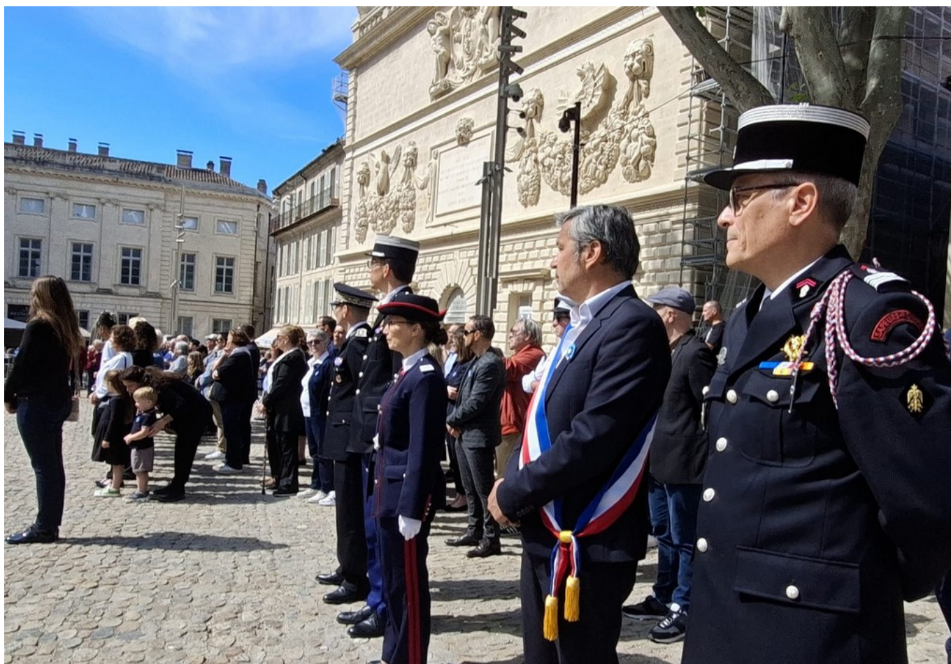
Le patron des pompiers et le maire d'Avignon.