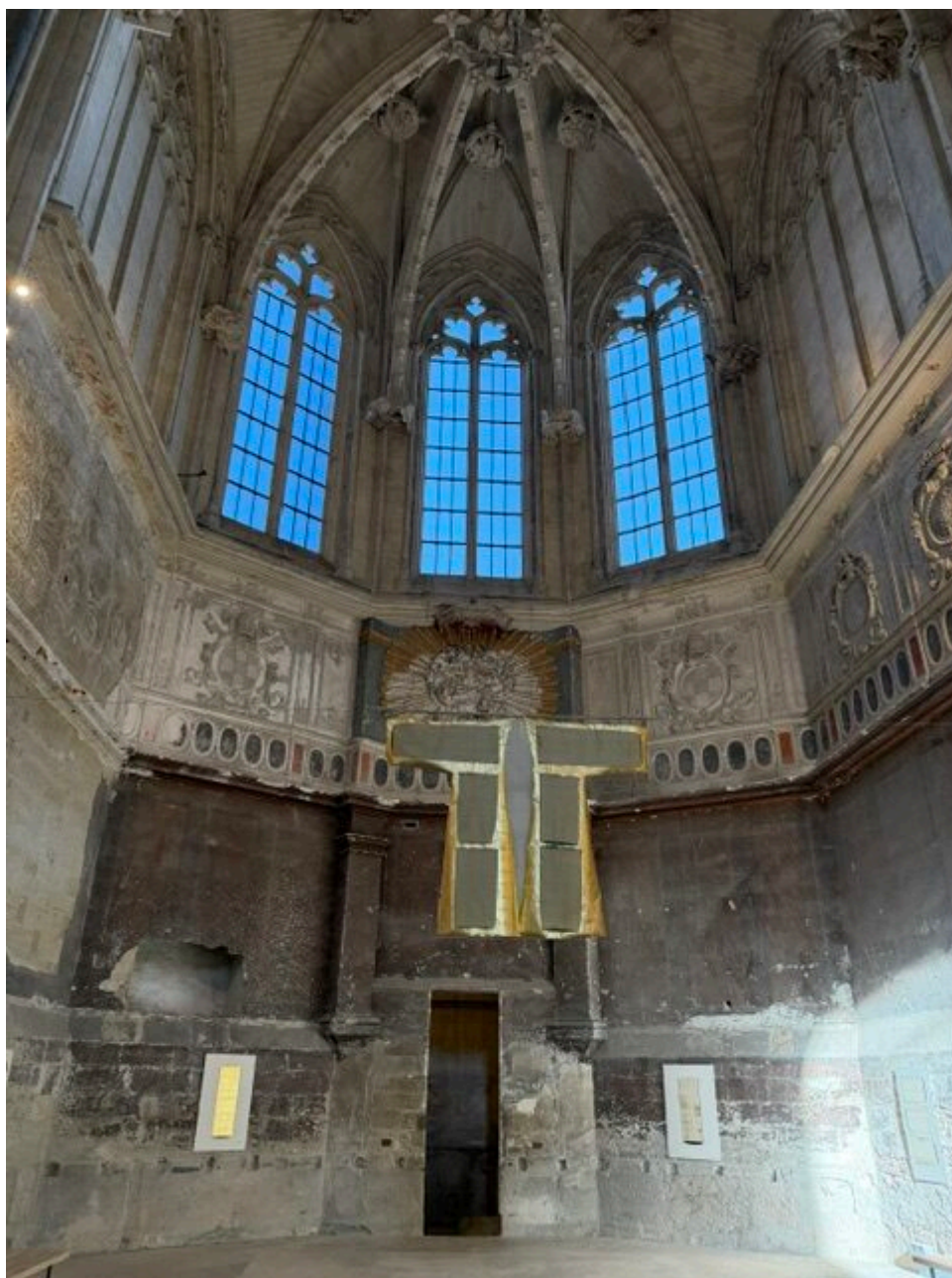
L'habit de l'ange, oeuvre de Louise Cara, copyright MMH