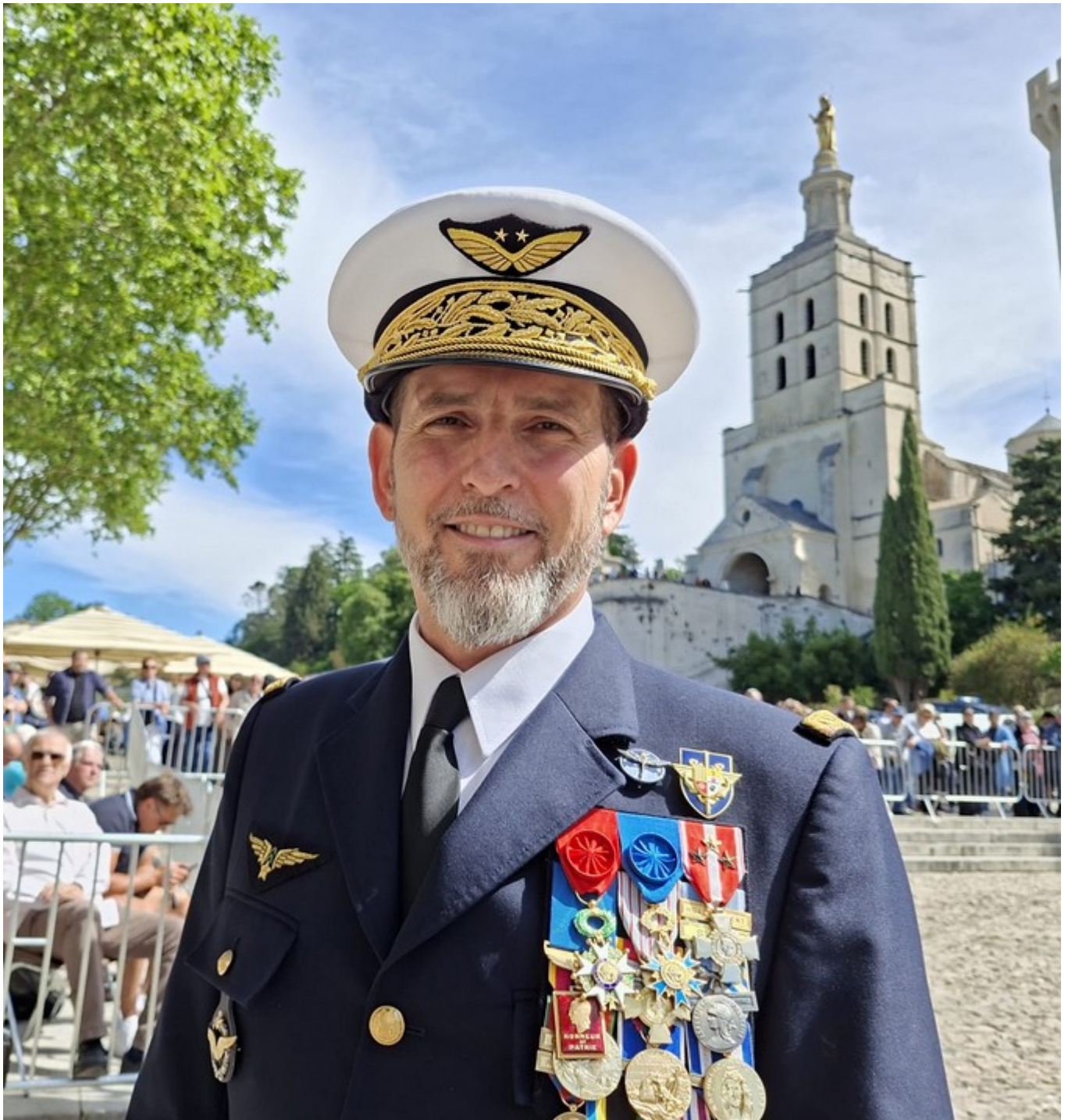
Le général Jean Luc Daroux, promu « Commandeur de l'ordre national du mérite » le 8 mai à Avignon