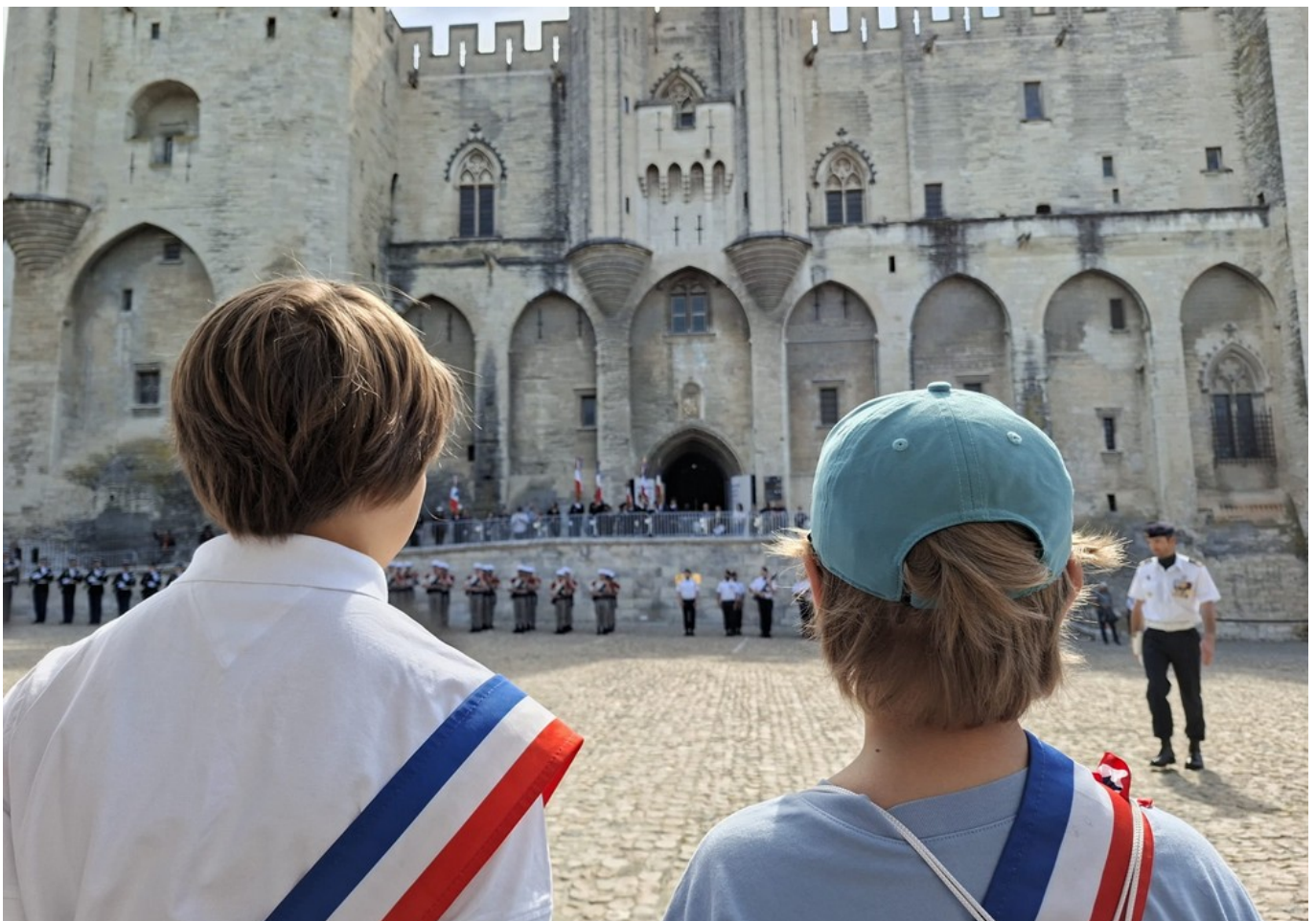
Les écoliers du Conseil Municipal des Enfants d'Avignon.