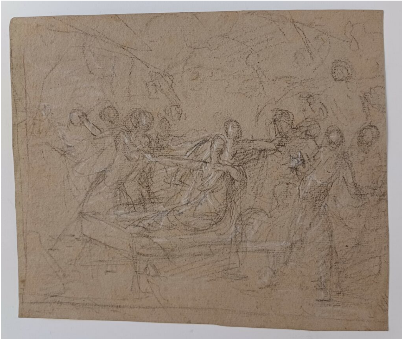
Croquis de Alfred Persia