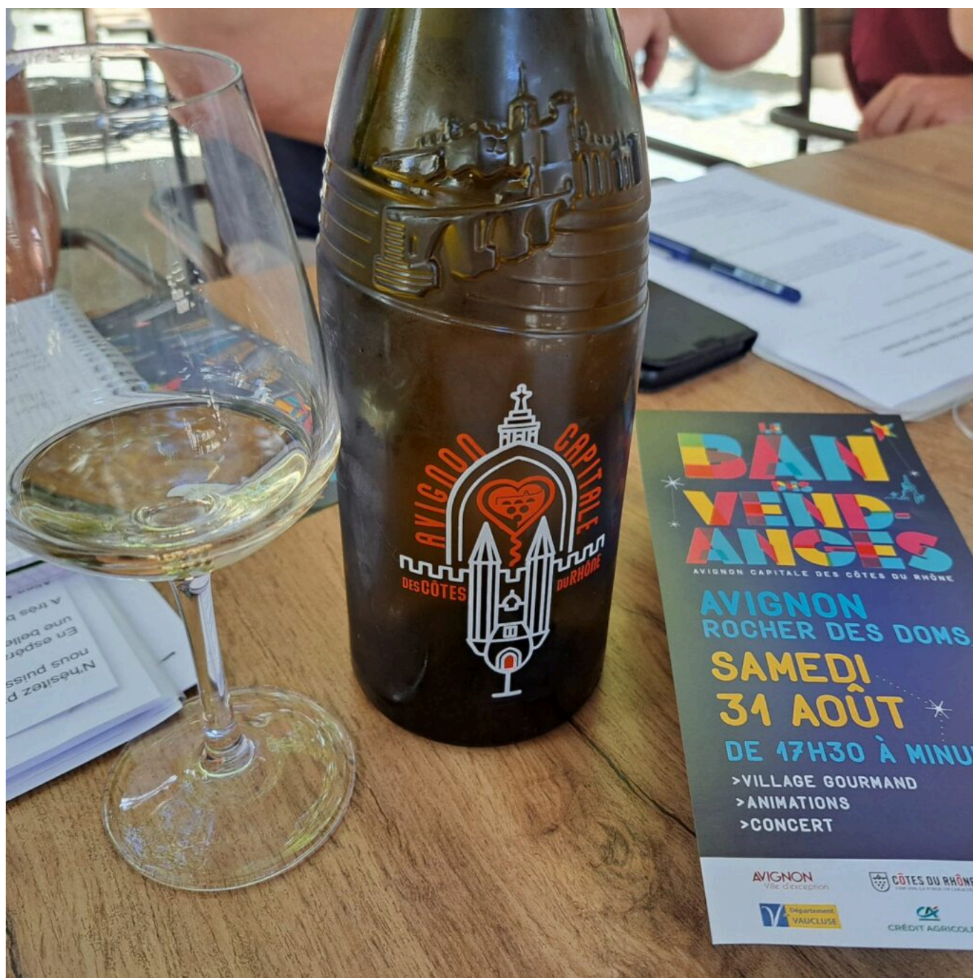
La bouteille 'Avenio'

'Avenio' la bouteille des Côtes du Rhône, vedette du Ban des Vendanges le 31 août