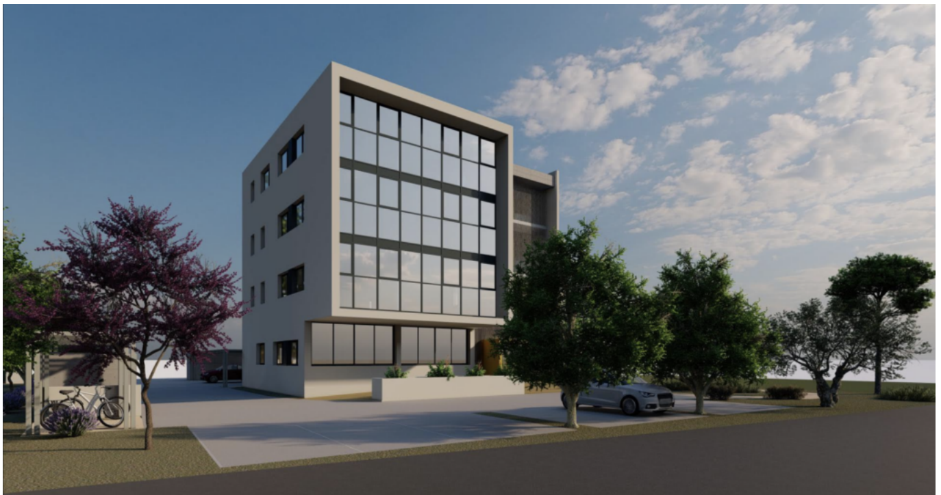
Maquette finale du futur pôle médical d'Agroparc.