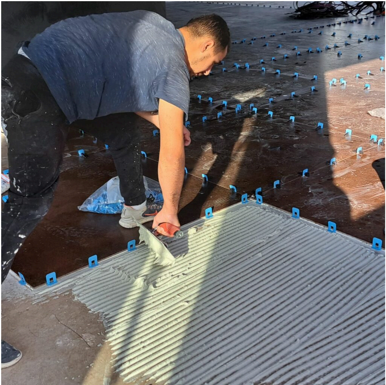
Pose du carrelage

avoir posé des carreaux foncés de 120cm de côté sur le sol, c'est au tour de plaques de marbre clair de Carrare, sur les murs de la cuisine, de plusieurs centaines de kilos chacun, qui sont déplacés délicatement, avec des ventouses comme pour changer un pare-brise. « Il faut faire très attention, explique Rachid Ghzal , quand on les pose, ils ont le même numéro de série pour constituer une sorte de frise murale, donc nous devons faire un raccord parfait en phase avec le veinage du marbre ».