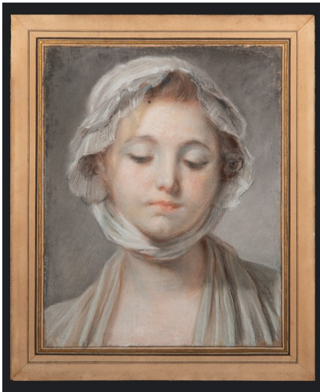
Jean-Baptiste Greuze. Etude pour l'accordée du village. Copyright Alexandra de Laminne