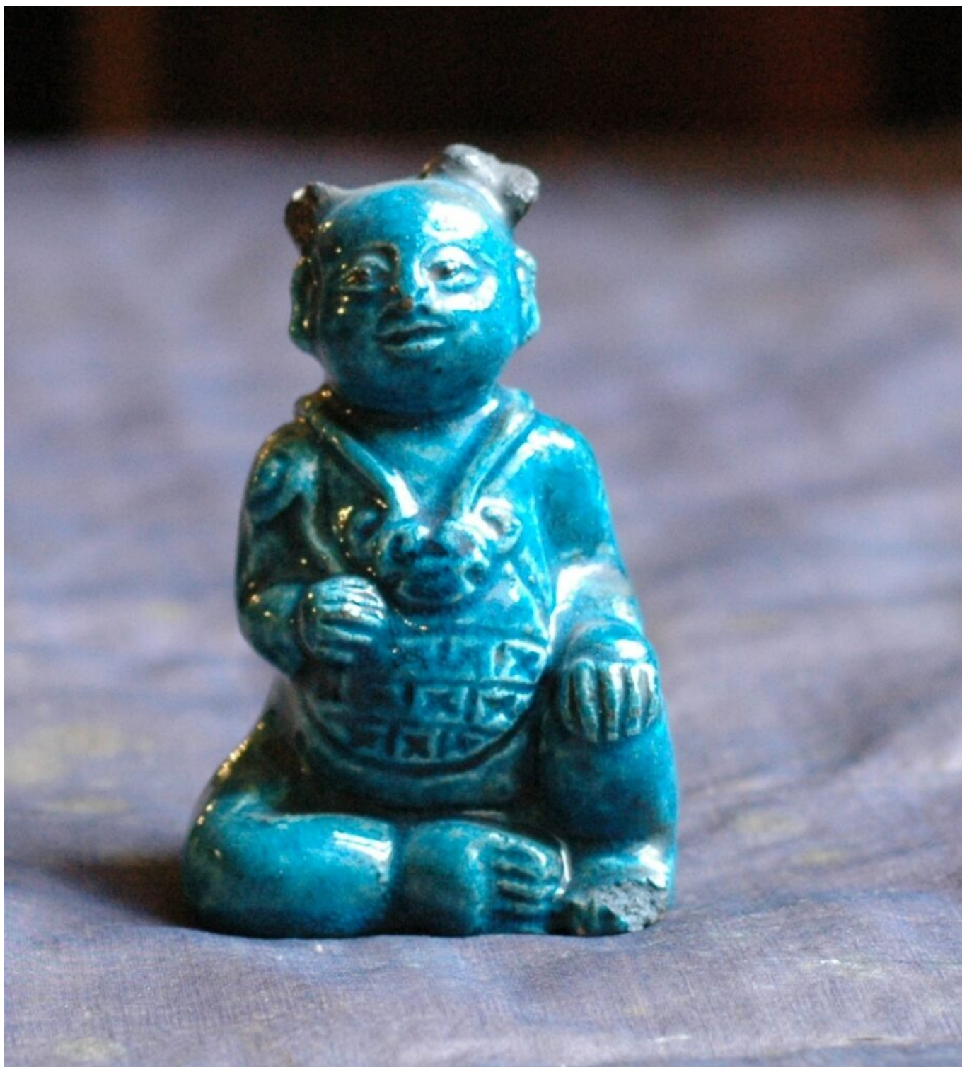
Enfant accroupi. Chine. 18e siècle.