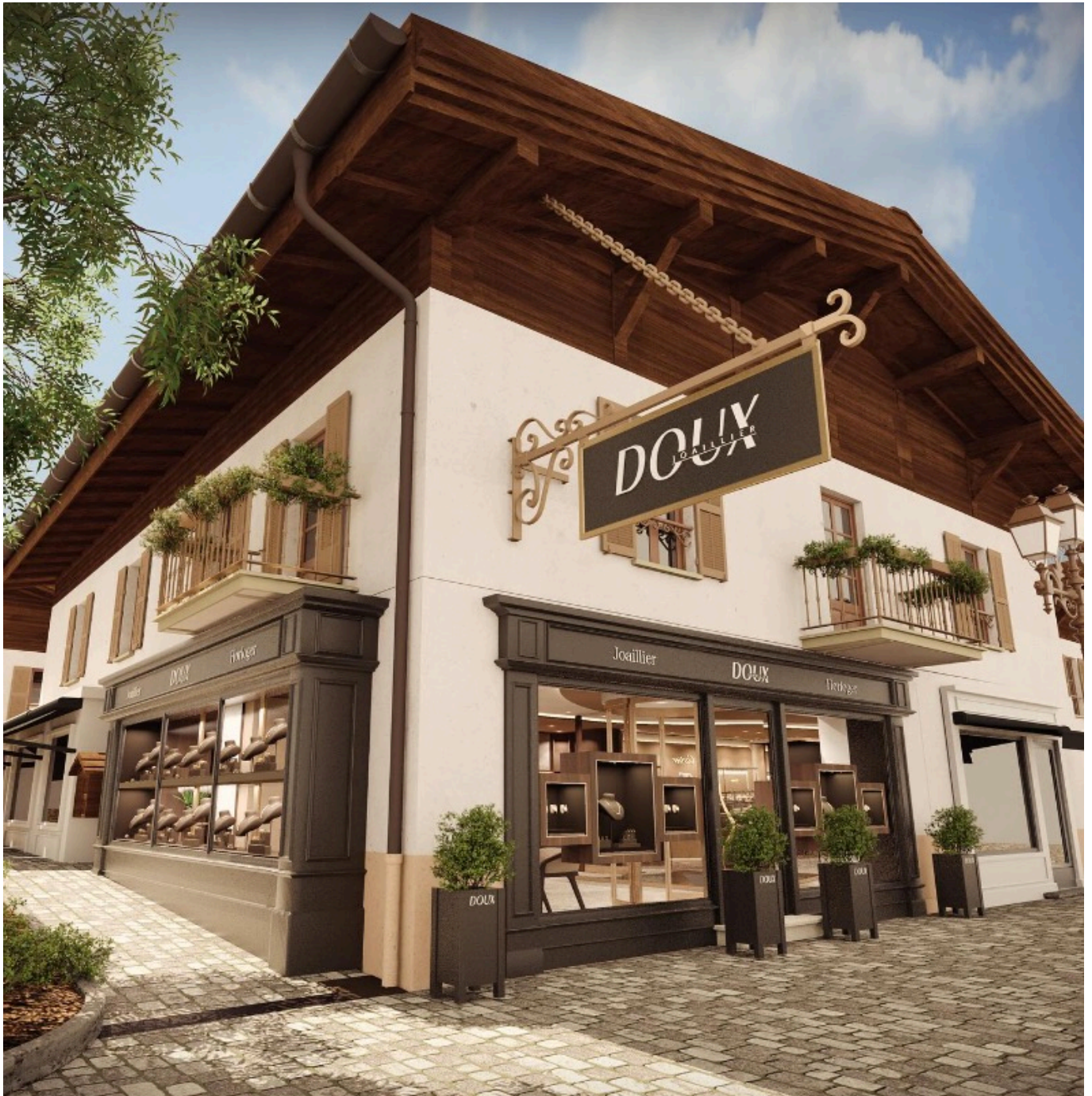
La future boutique Doux à Mègeve