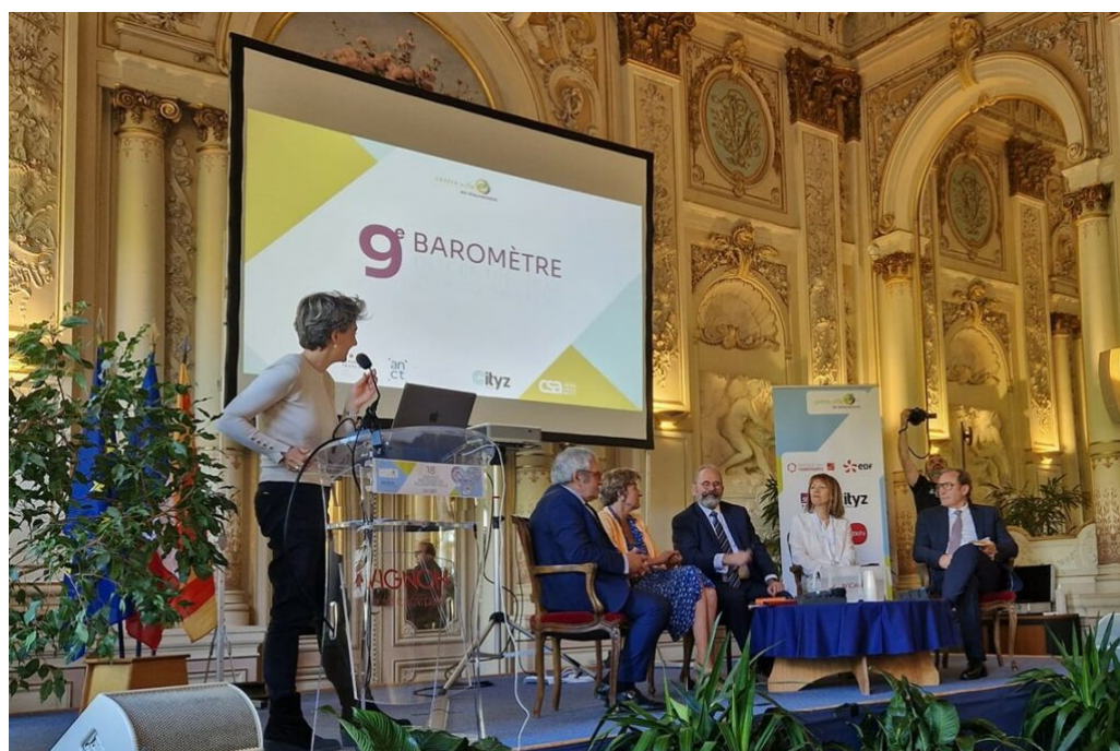
Présentation du 9e baromètre du centre-ville et des commerces à la mairie d'Avignon.

La question environnementale devient aussi un enjeu majeur notamment avec la création d'aménagement ayant pour but de lutter contre les îlots de chaleur.