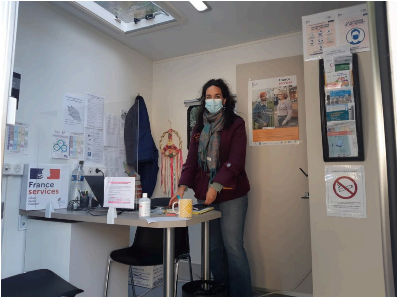
Les agents conseillent les usagers.