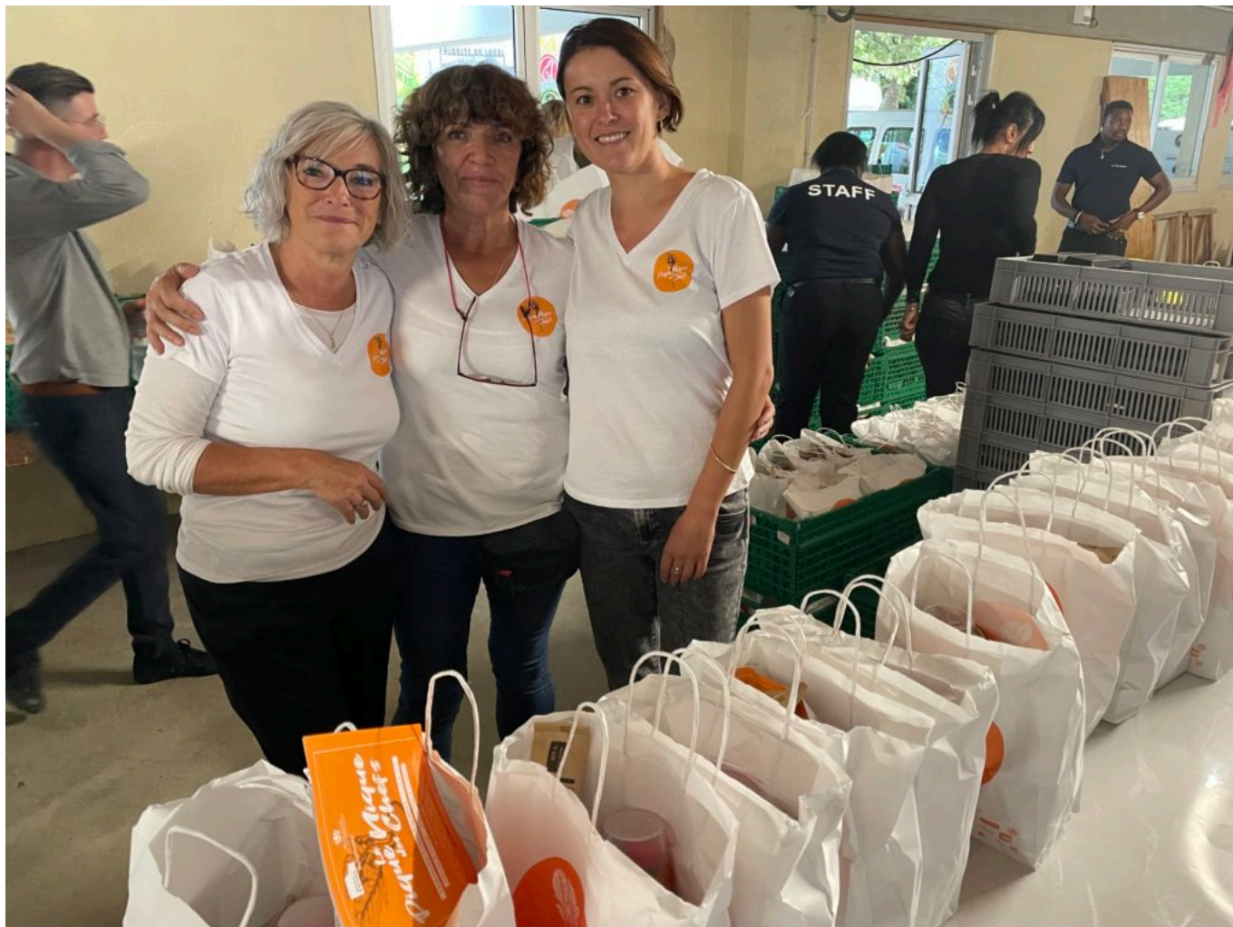
Des bénévoles pour la distribution des paniers du pique-nique des chefs