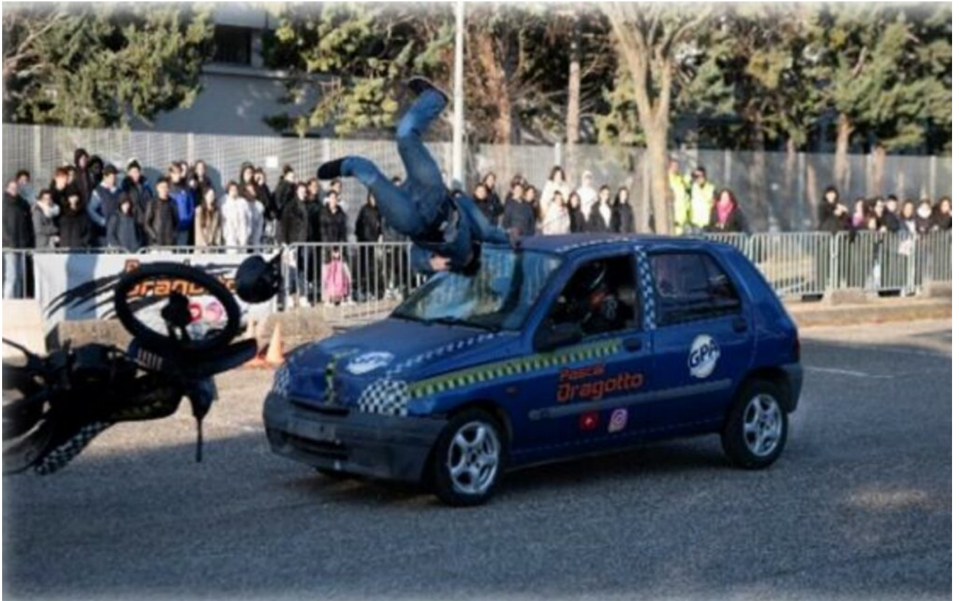
Exercice Sécurité routière