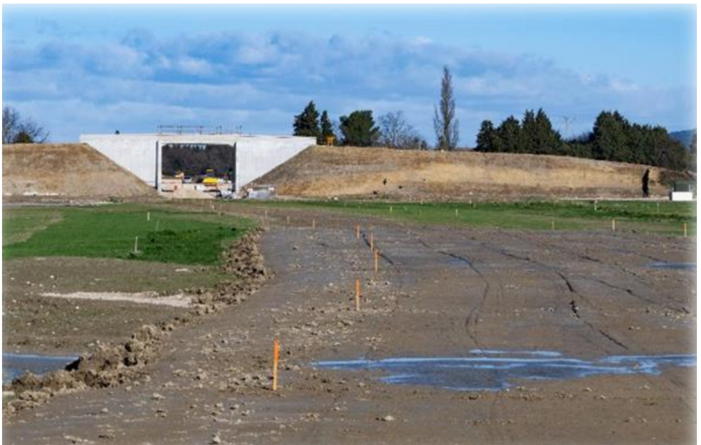
Terrassement du Chemin de Nogaret

Les travaux ont démarré en juillet, pour une réception du bâtiment en mai 2025. La réhabilitation du collège Lou Vignarès à Vedène se poursuit : Les travaux de la phase 2, qui comprend la restructuration et l'extension des bâtiments administratifs, vont se poursuivre jusqu'en septembre 2025. La fin du chantier est prévue début 2026, après réalisation des aménagements paysagers et la dépose du collège provisoire.