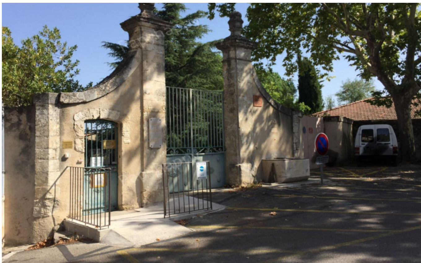
Ehpad de Cucuron