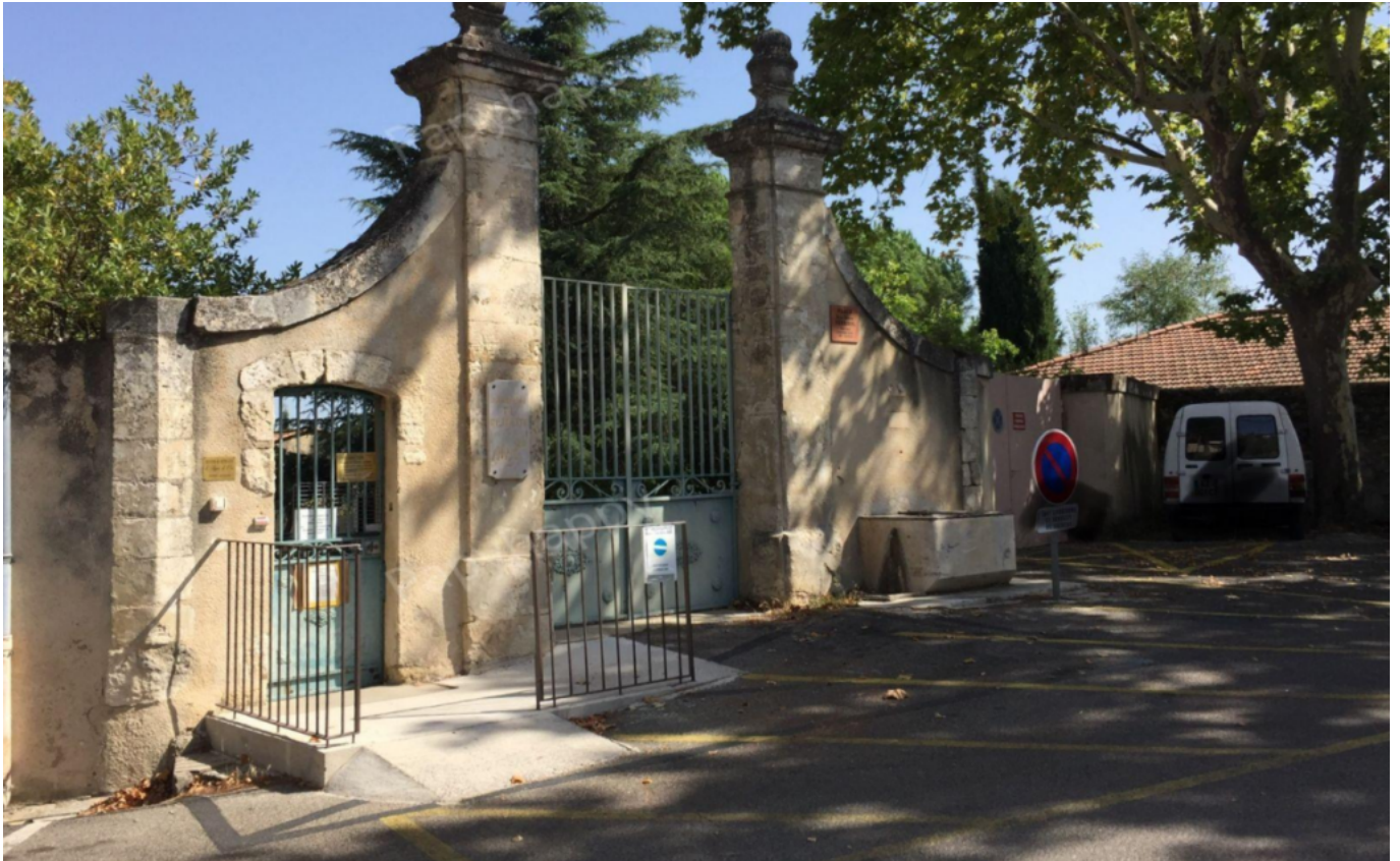
Ehpad de Cucuron