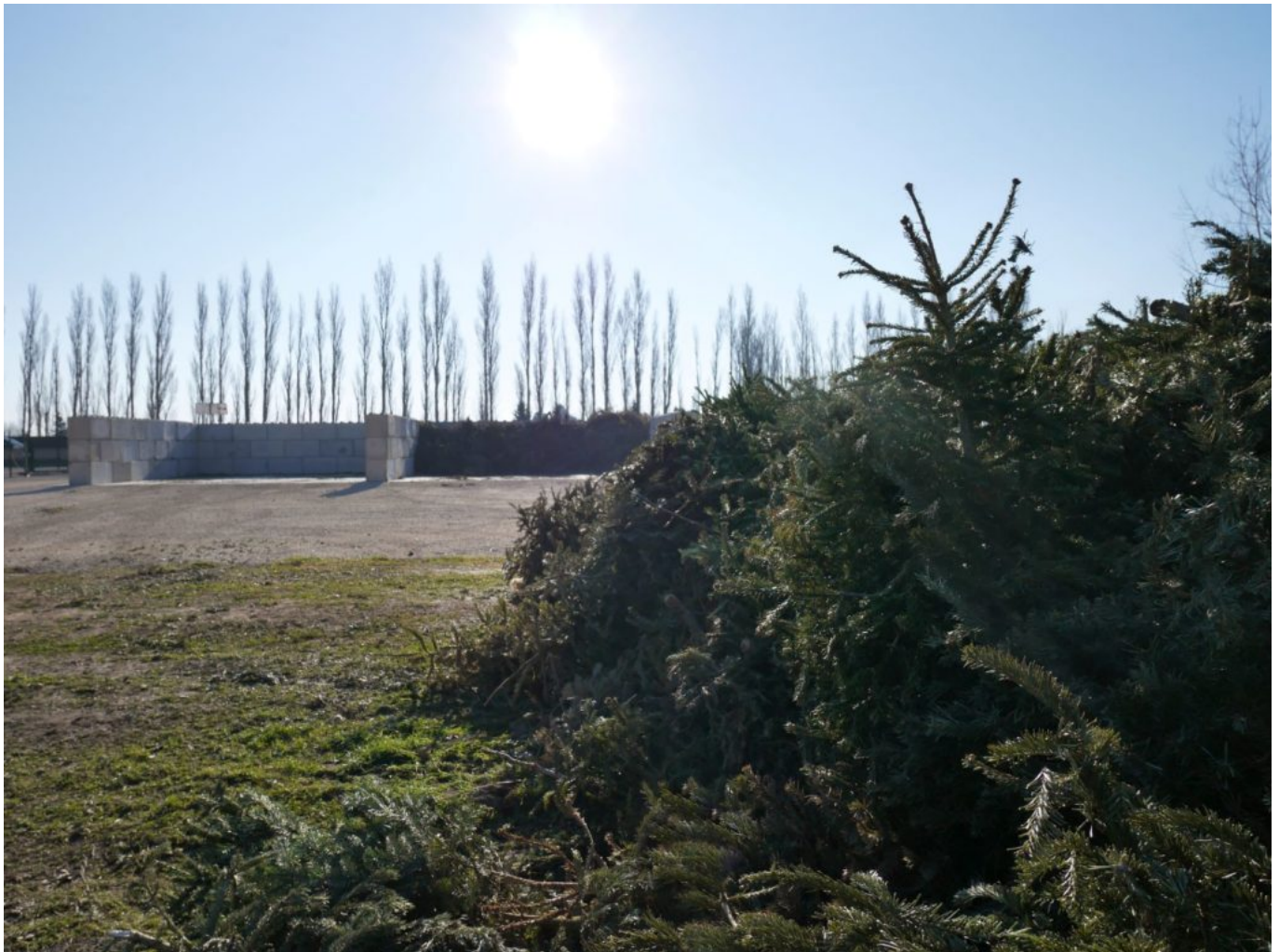
Plateforme de déchets verts à Althen-des-Paluds