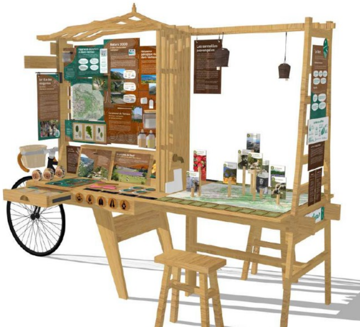
La Ventilotte