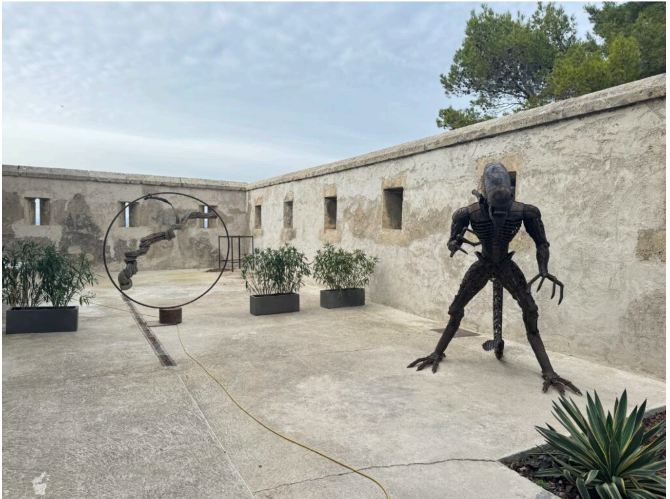
L'art, nouveau gardien des lieux

accueillant des musiciens et projetant des tableaux dans l'atrium. Des vernissages fréquents ainsi que des expositions de tableaux ont également eu lieu. Enfin, le site s'inscrit dans l'aménagement d'une nouvelle promenade touristique reliant les écluses de Fonsérannes et la Cathédrale de Béziers.