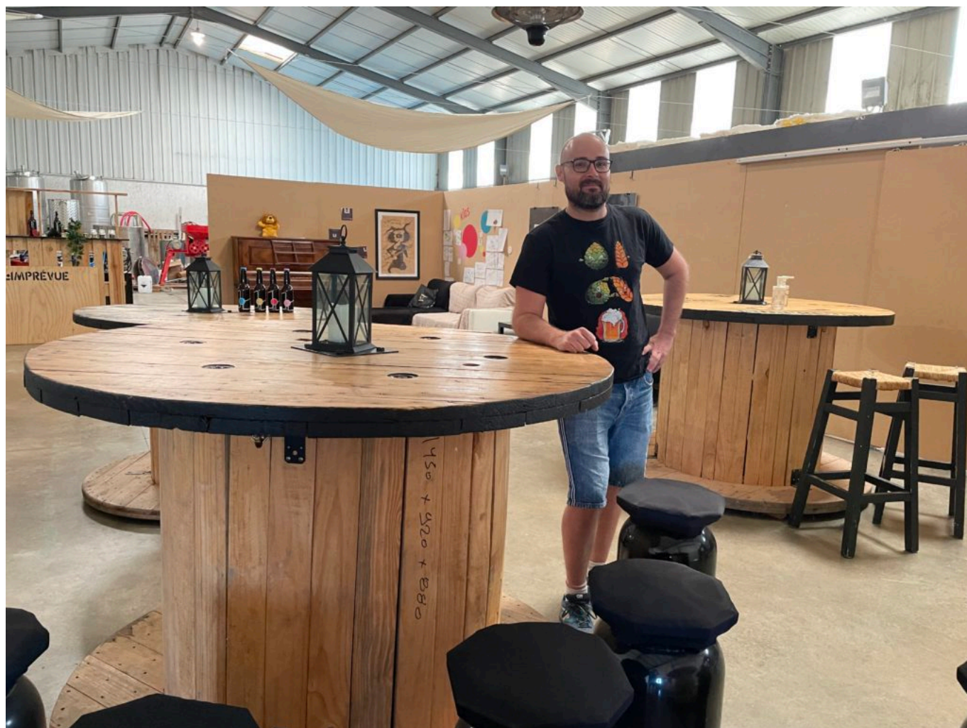
L'espace bar de l'Imprévue