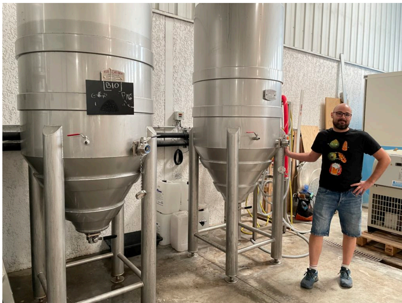
L'espace brasserie, outil de production de l'Imprévue parfois partagé avec d'autres brasseurs

Et la Voluptueuse Sweet Stout en rose -le rose pour la douceur et la volupté-est une bière brune (5% noire), douce et gourmande aux saveurs de café et de cacao avec une note de noix et à l'amertume modérée.