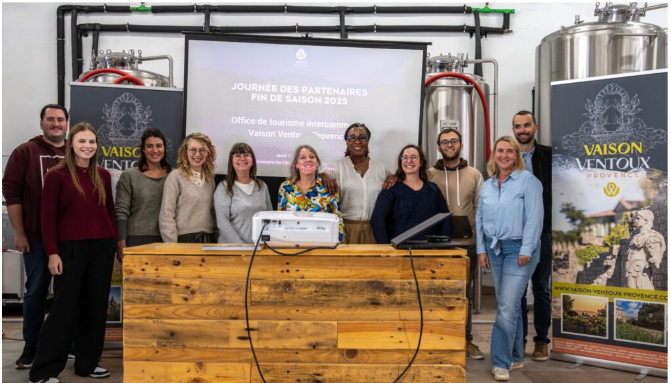
Journée des partenaires 16 octobre 2025

L'Office de tourisme enregistre une baisse de fréquentation physique : -8% sur les points d'accueil, mais une explosion de la visibilité en ligne : +259% de visiteurs uniques sur le site web et une forte progression sur les réseaux sociaux : +6% sur Facebook, +20% sur Instagram. Une dynamique numérique portée par la création de capsules vidéo immersives et de nouveaux contenus valorisant artisans, paysages et savoir-faire locaux.