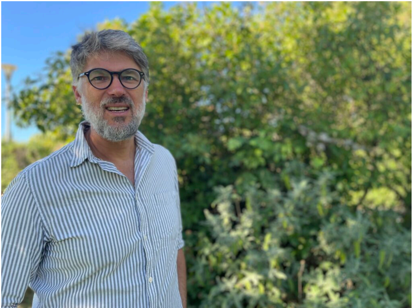
Etienne Klein