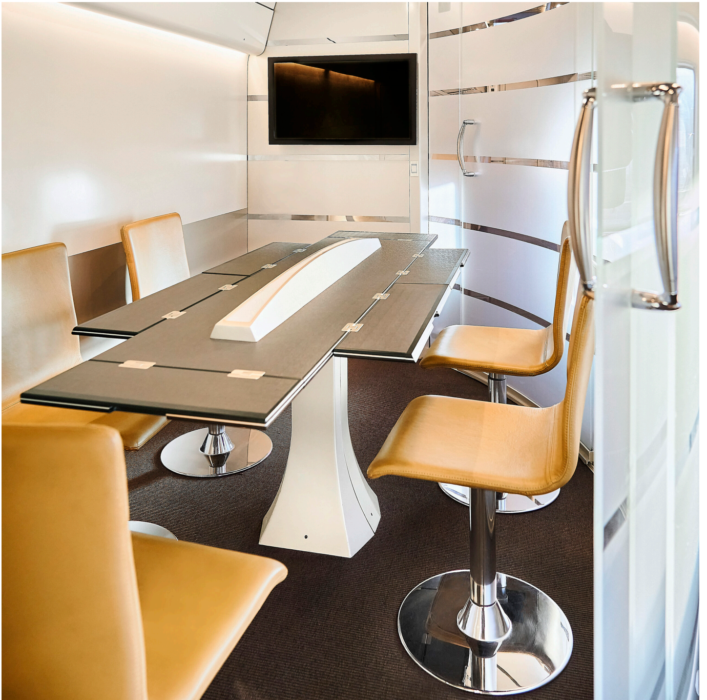
Salle de réunion à l'intérieur dans la classe exécutive