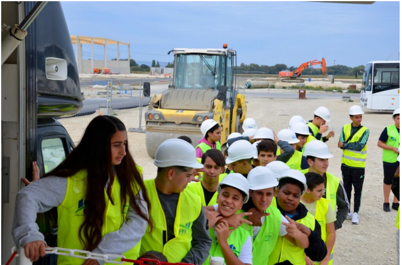
Les Coulisses du BTP à Bollène