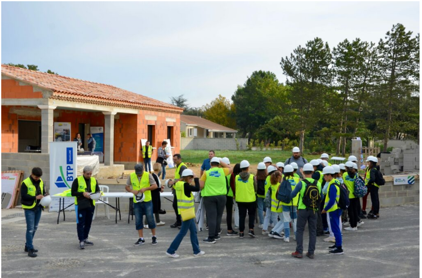
Les Coulisses du BTP à Orange sur un chantier du Groupement d'artisans