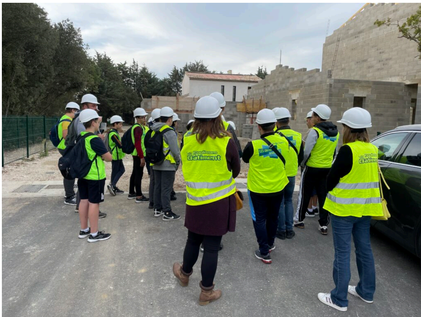
Comprendre les métiers du bâtiment et des travaux publics