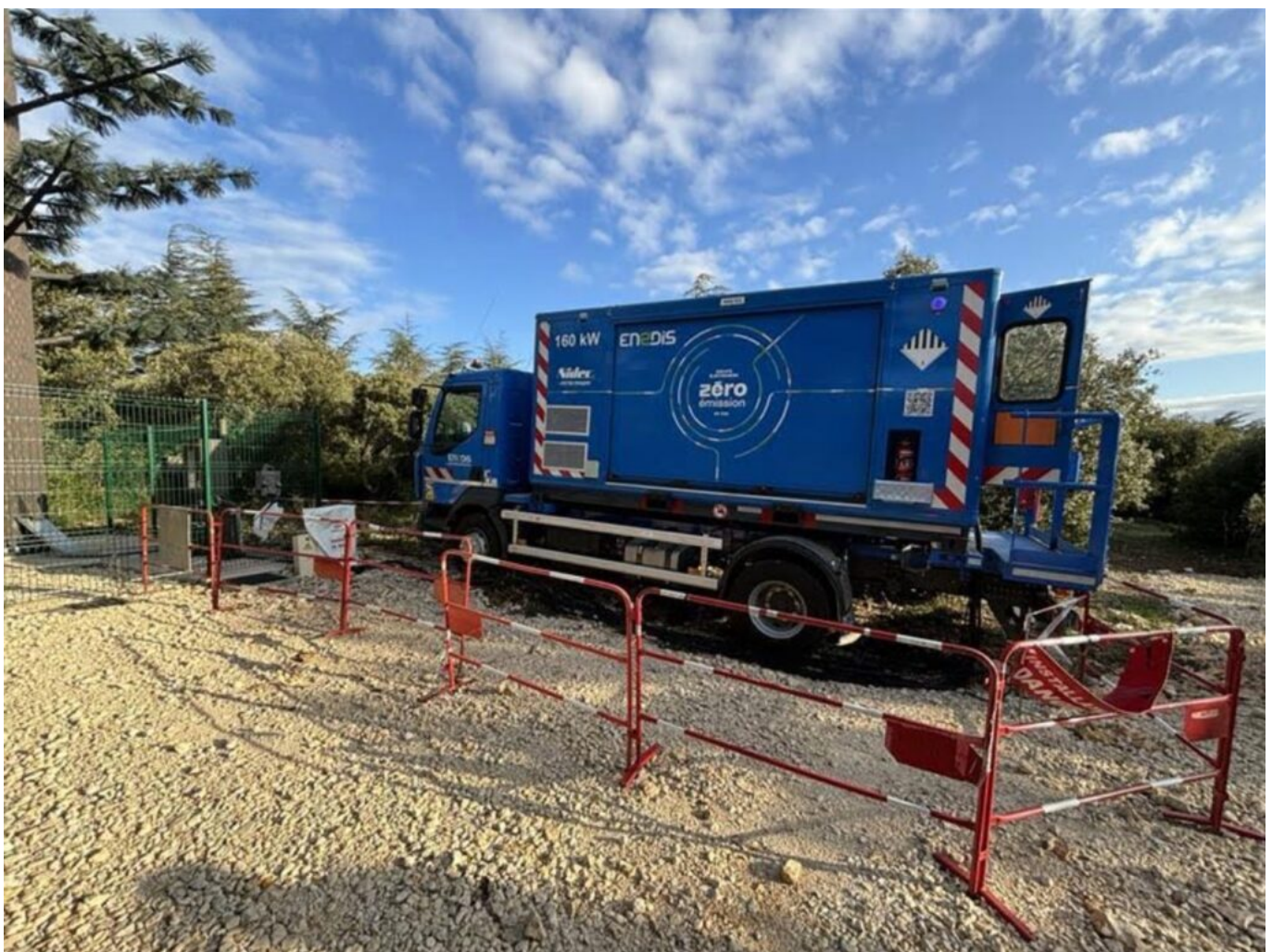
Le groupe électrogène zéro émission.

Le diagnostic des lignes est réalisé par les équipes d'Enedis à l'aide d'une intelligence artificielle qui établit le diagnostic final à partir d'un traitement de données et qui évalue l'ensemble de matériel nécessaire à la remise en état complète des portées aériennes. Pour le bon déroulement des travaux et éviter des coupures d'électricité trop longues, neuf groupes électrogènes ont été installés, dont un zéro émission qui ne produit ni d'émissions de CO2 ni de pollution sonore.