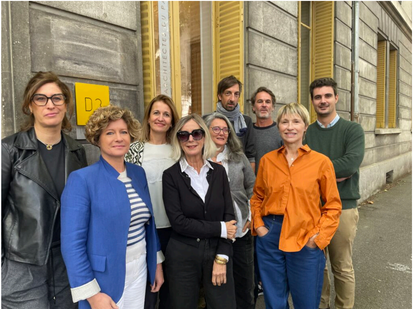
Les coworkers du D3