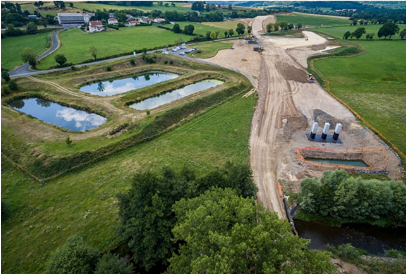
Travaux NGE