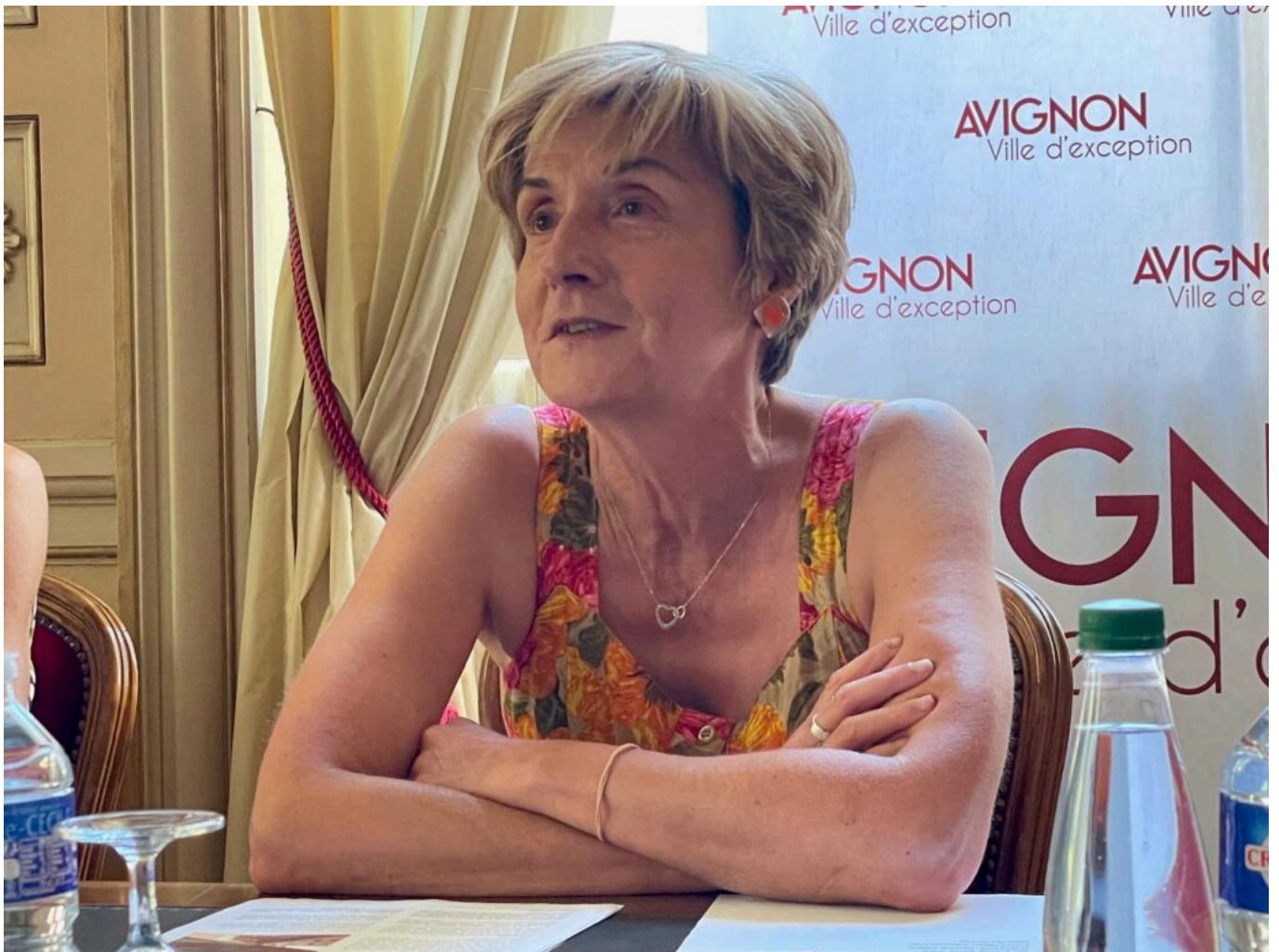
Cécile Helle, maire d'Avignon