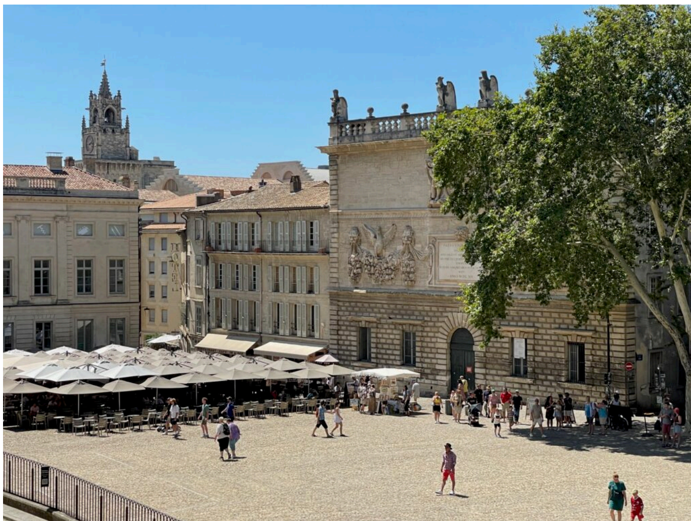
Hôtel Niel et Hôtel des Monnaies, place du palais des papes