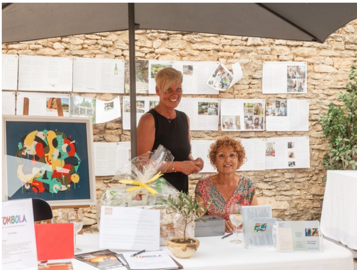
L'association SErEn'Âge.