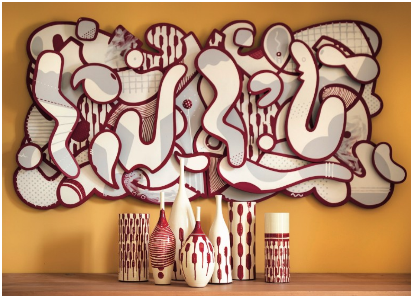
'Mondo Vision' de Mambo