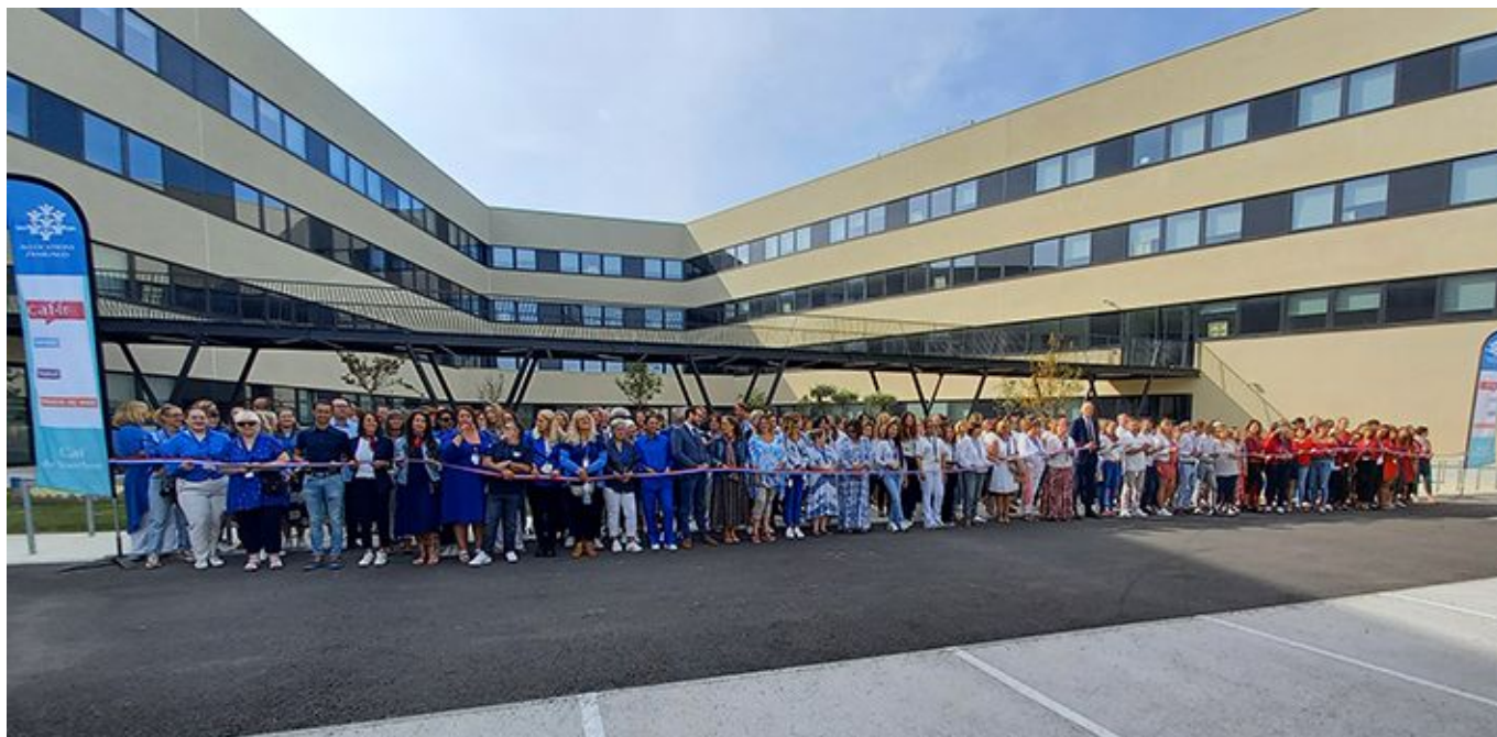
Les agents de la Caf 84 lors de l'inauguration.

Par ailleurs, afin de faciliter l'accès des usagers un parking gratuit et sécurisé est disponible au niveau du boulevard Pierre-Boulle. Le site est aussi desservi par 3 lignes de bus, la 'virgule' ferroviaire de la gare TGV ainsi que plusieurs pistes cyclables.