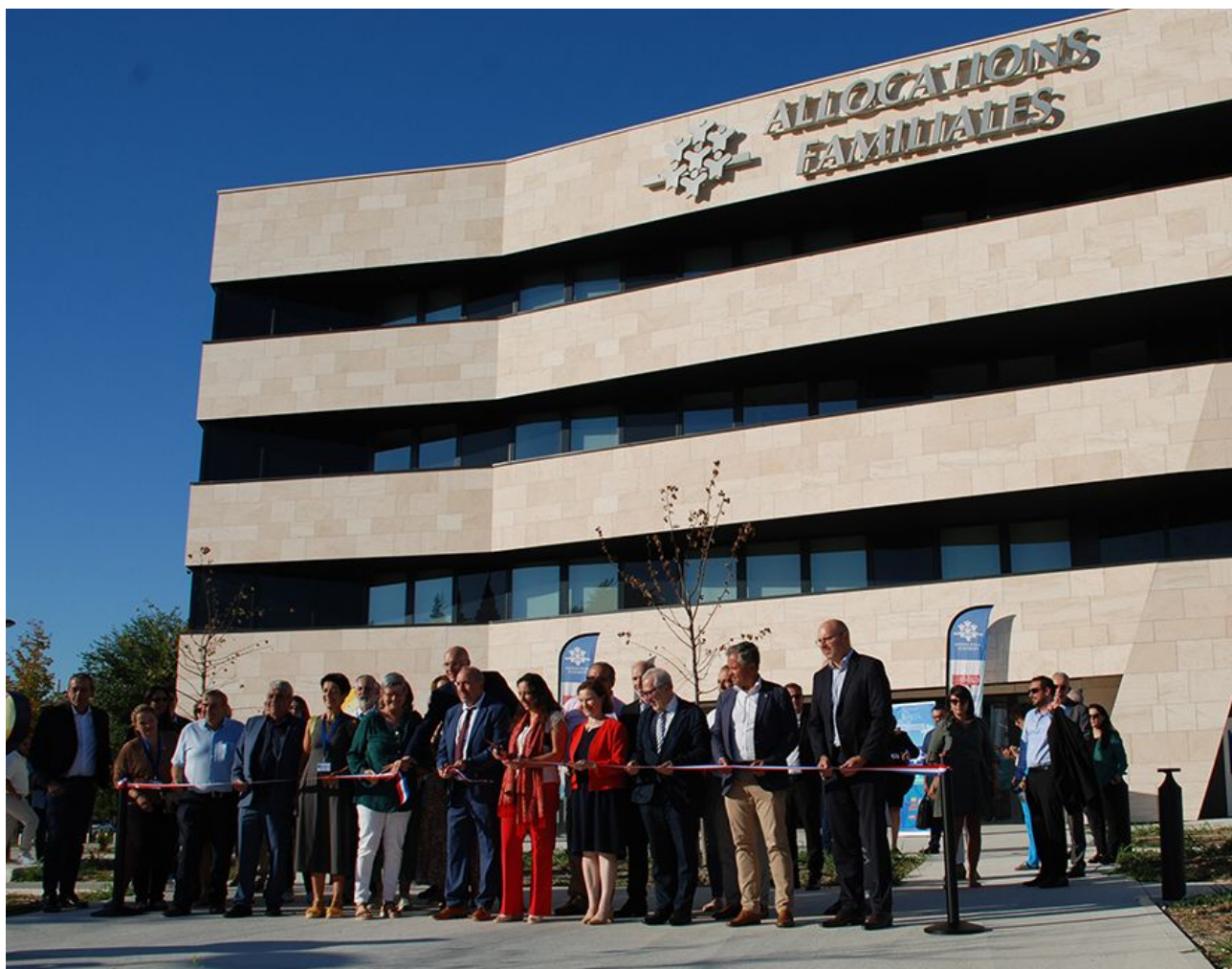
L'inauguration officielle du nouveau siège de la Caf de Vaucluse.

Même satisfaction pour Joël Guin, président du Grand Avignon, qui lançait il y a peu le 1 er macro-lot de Courtine qui verra le jour à quelques mètres seulement du nouveau siège vauclusien de la Caf.