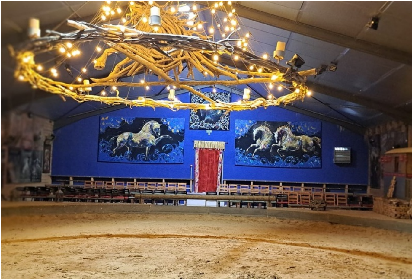
La piste où sont donnés les spectacles