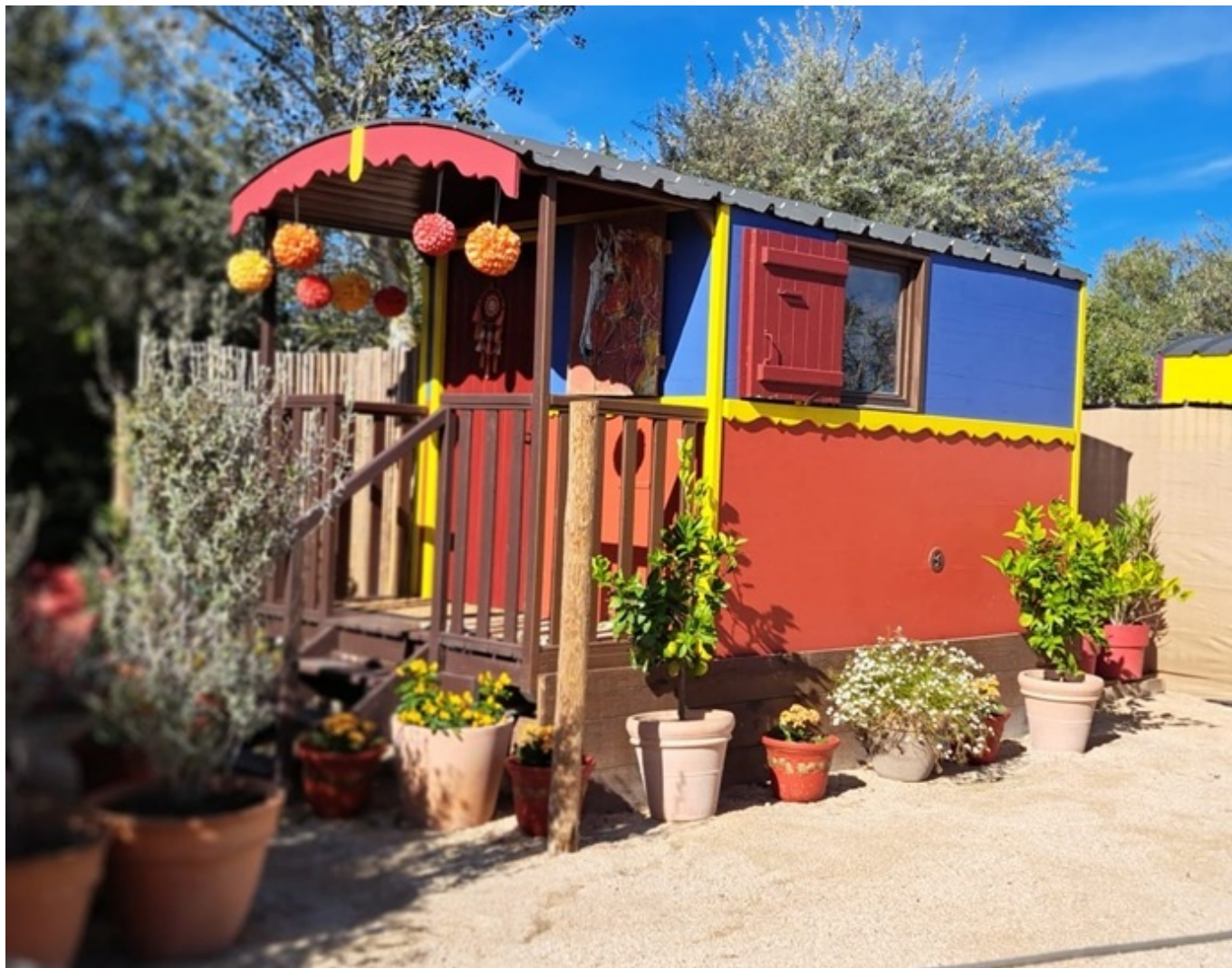
Une des roulottes où on peut passer la nuit