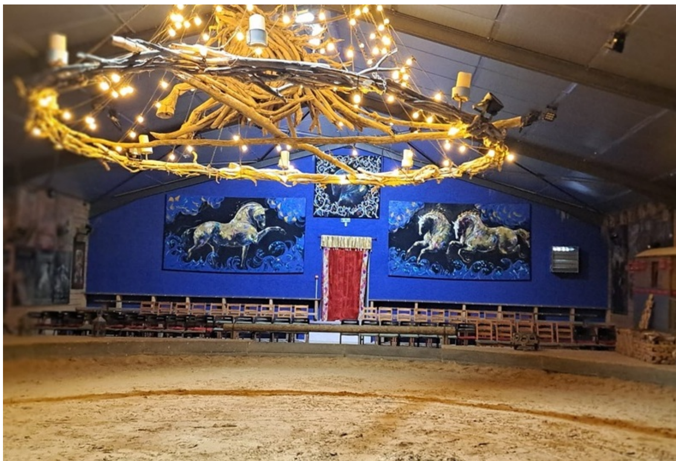
La piste où sont donnés les spectacles