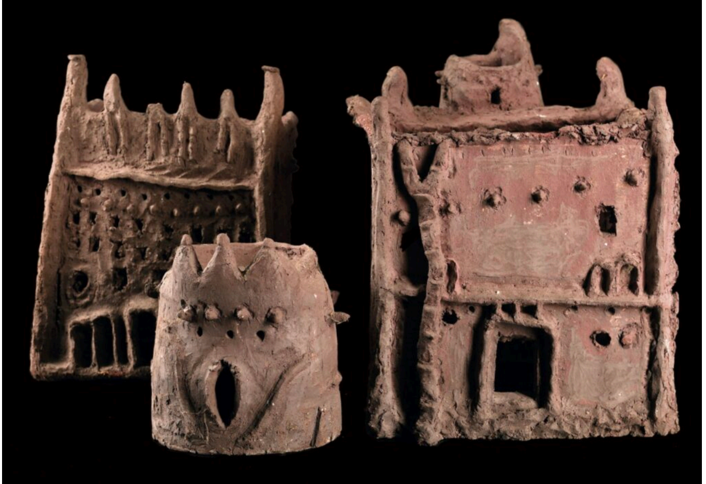
Oeuvre de Amahiguere Dolo. Prêt de la fondation Blachère DR

humaines et les liens invisibles, spirituels, qui unissent les êtres à leur territoire.