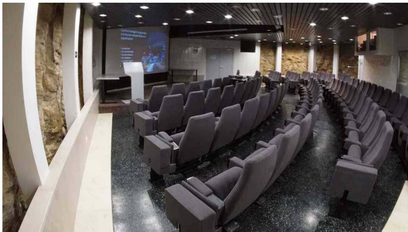
Amphithéâtre, campus Haut Provence.