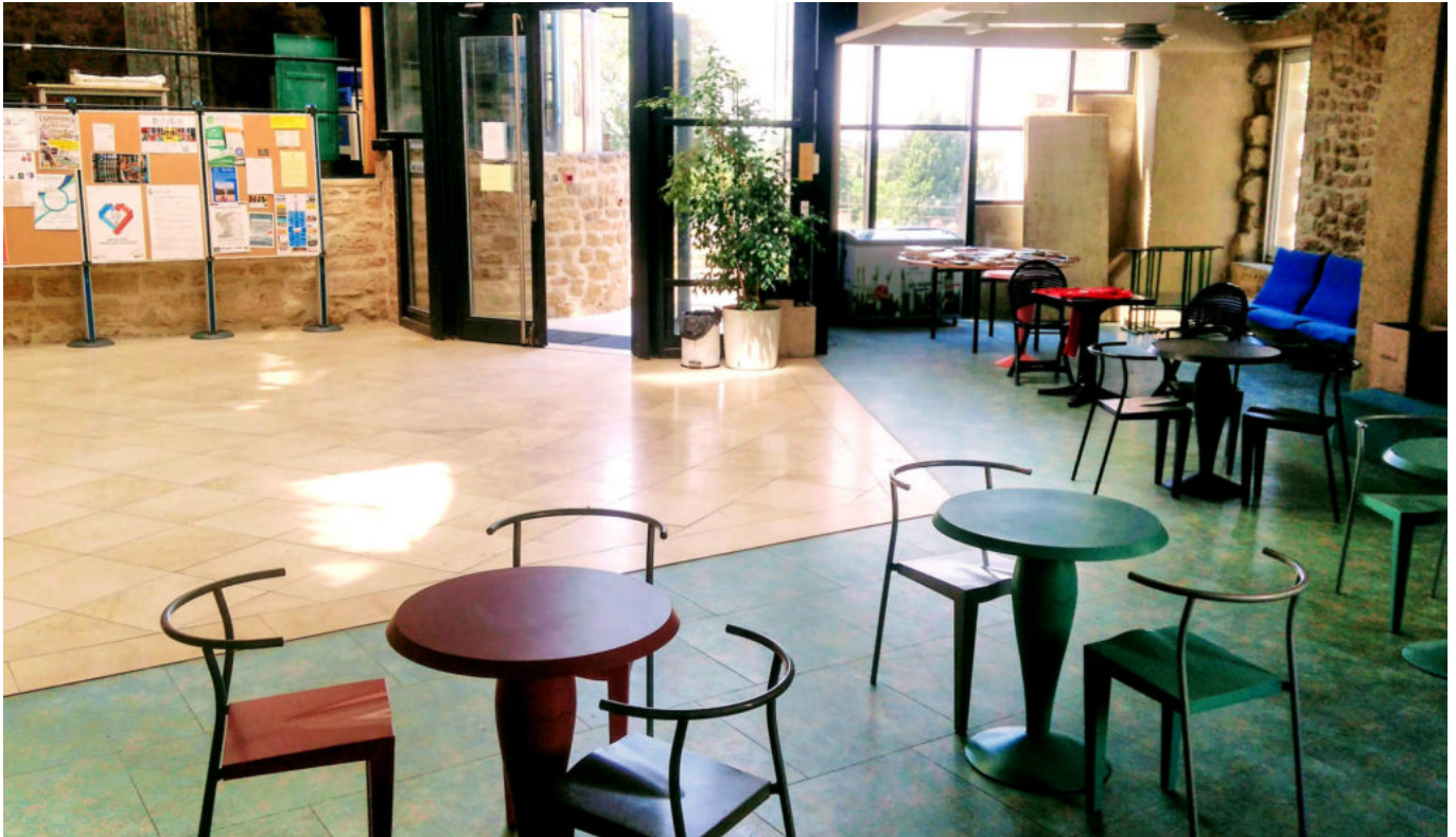
L'Atrium, campus Haut Provence.

du Conseil départemental à travers une aide de 36 000€ pour l'équipement informatique. Porté par la Communauté de communes Enclave des Papes - Pays de Grignan, le Campus Hauts de Provence a pris ses quartiers dans la Maison Milon, une bâtisse du XVII e siècle restaurée et modernisée. Sur plus de 1 000 m 2 , le bâtiment comprend des salles de formation, des salles de réunion, un auditorium de 100 places, mais aussi un fablab (fabrication laboratory).