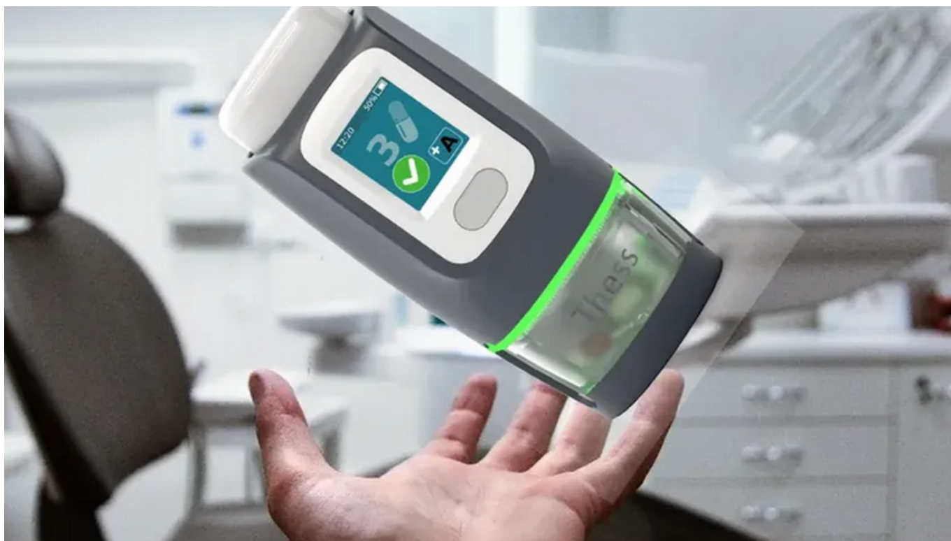
Le Therapy smart system DR