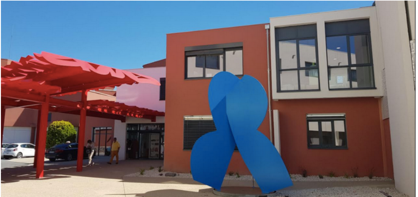
Bâtiment ambulatoire de Sainte-Catherine, Institut du cancer à Avignon