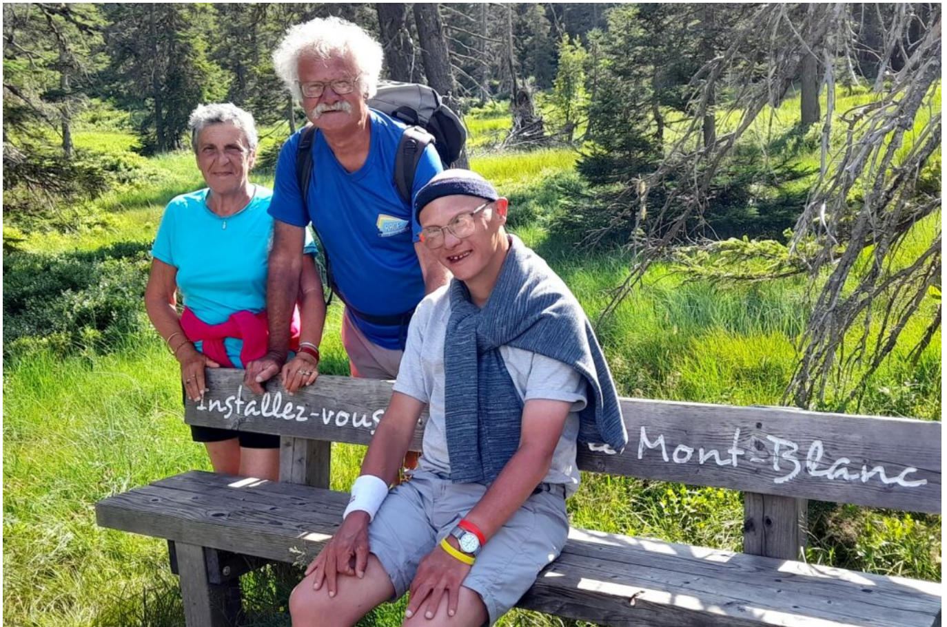
Une famille éprise de la montagne