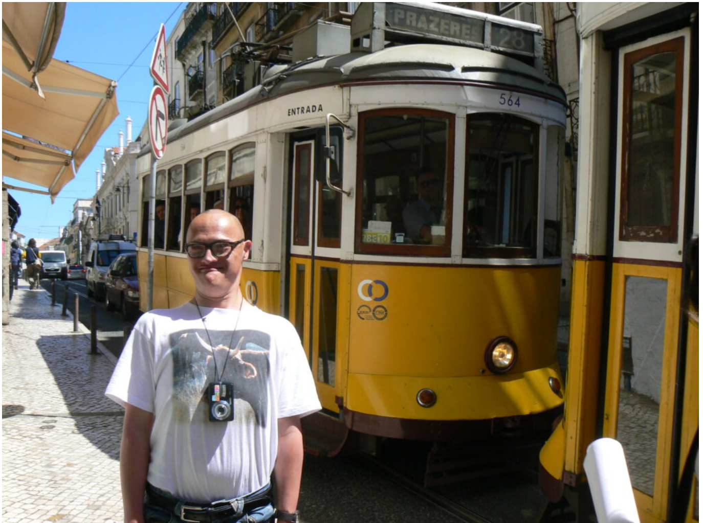
En voyage au Portugal