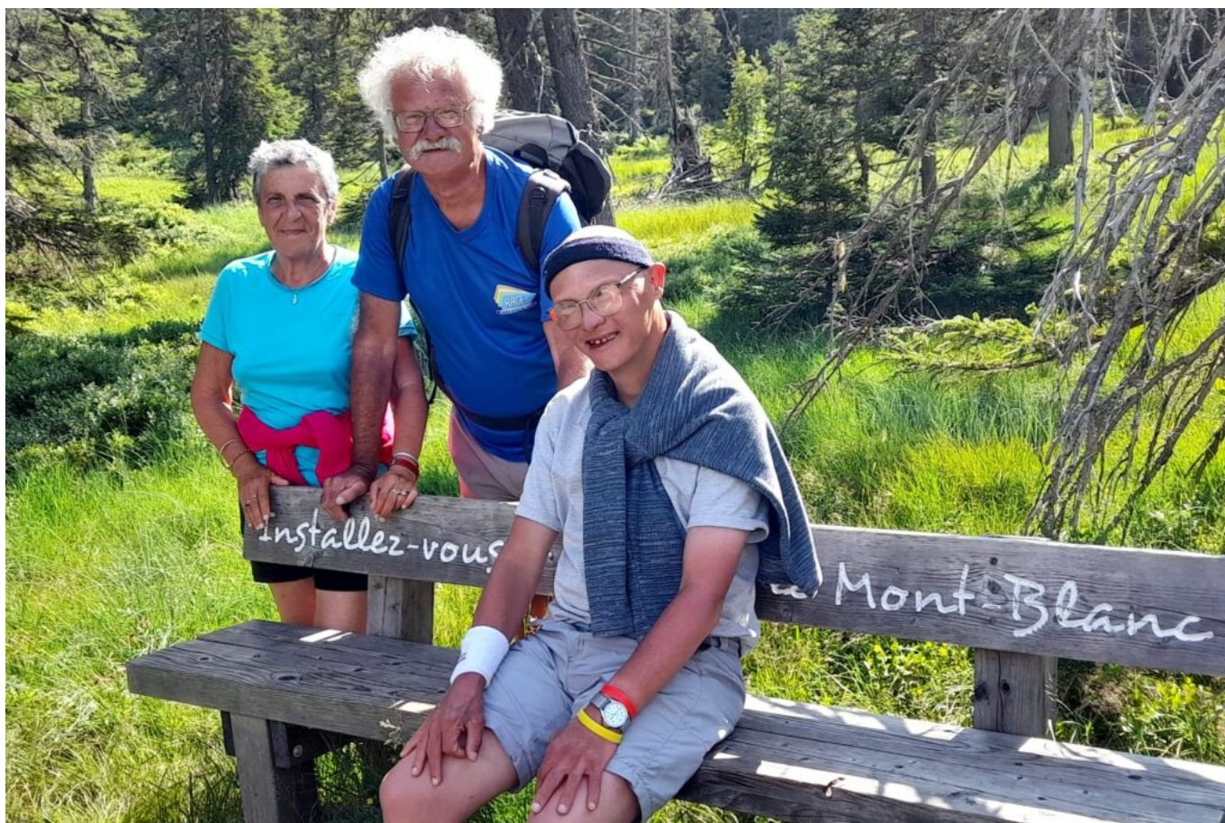
Une famille éprise de la montagne