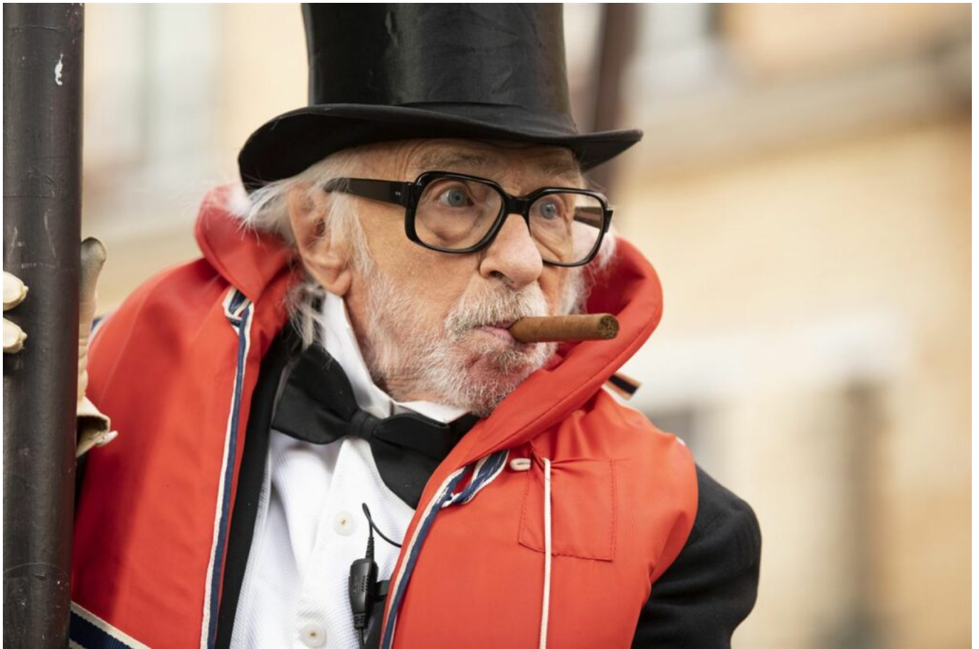
Pierre Richard, Les vieux fourneaux