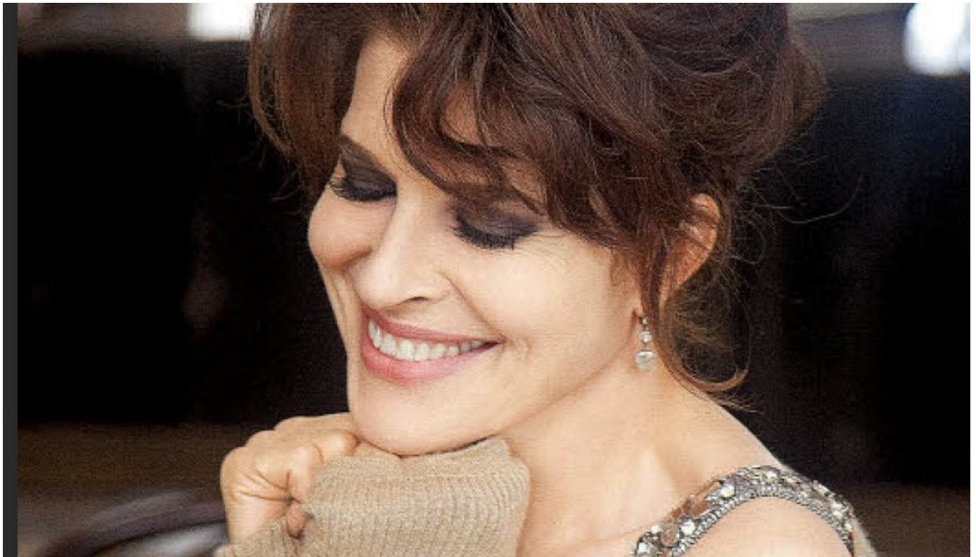
Fanny Ardant

Le teaser ? Il est ici et un autre ici . Les infos pratiques ici .