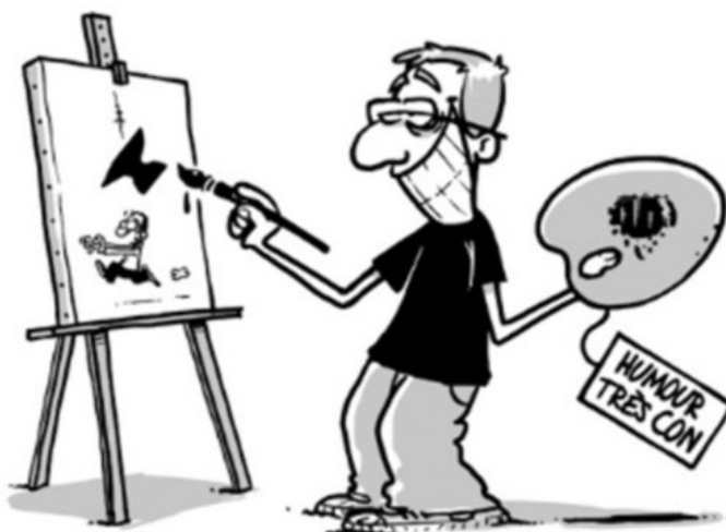
Wingz, alias Benjamin Roussé.