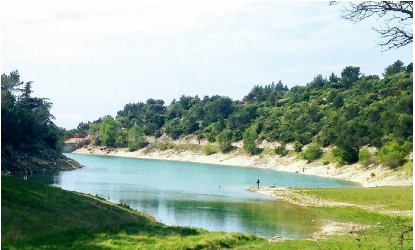
DR Le Lac du Paty à Caromb