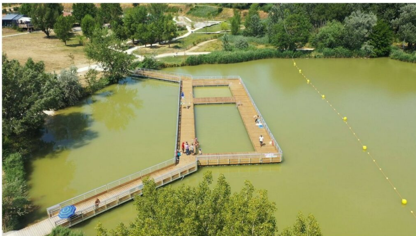
La Riaille à Apt