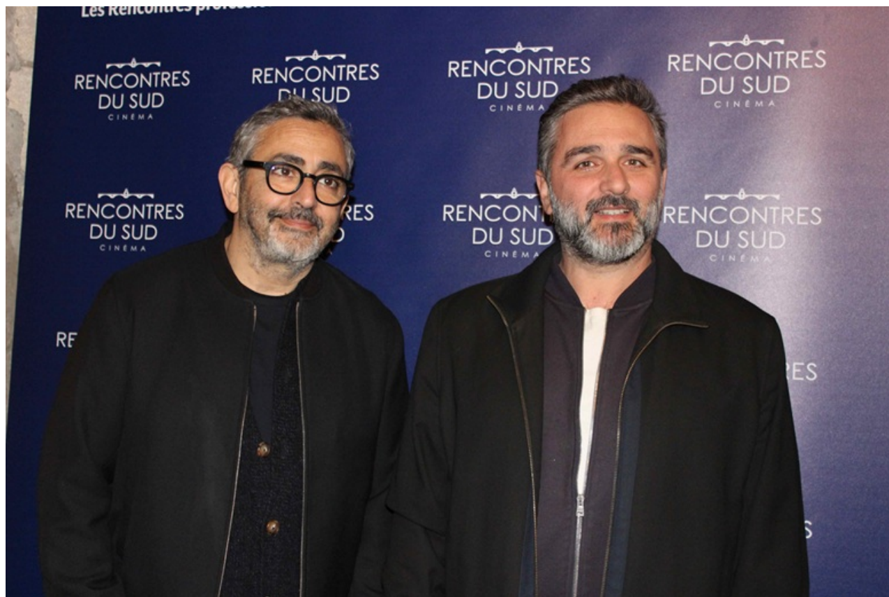
Eric Toledano et Olivier Nakache.