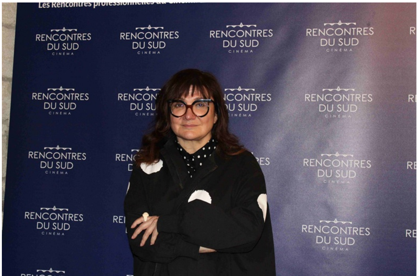
Isabel Coixet.