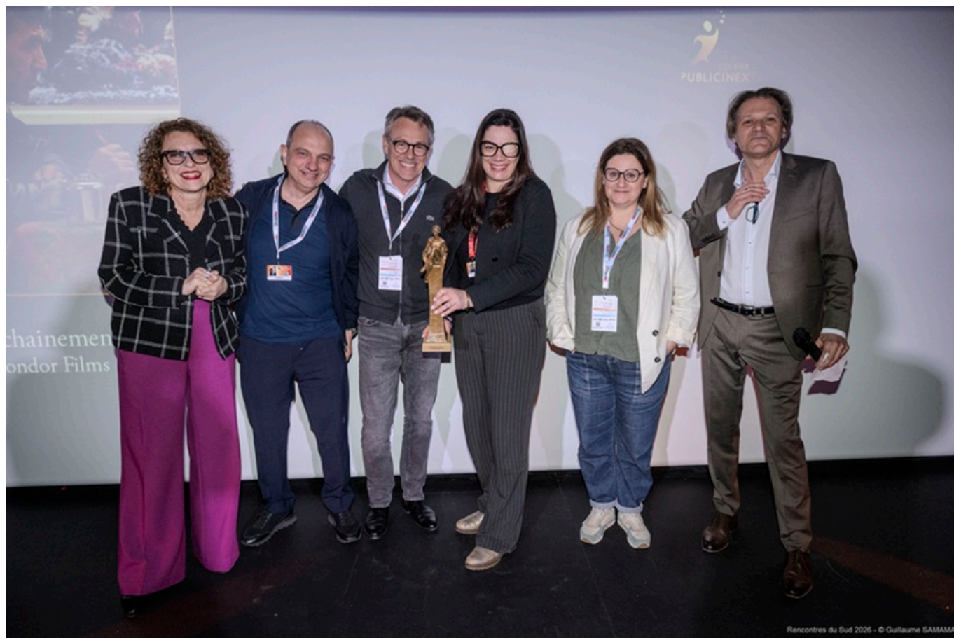
Prix du jury