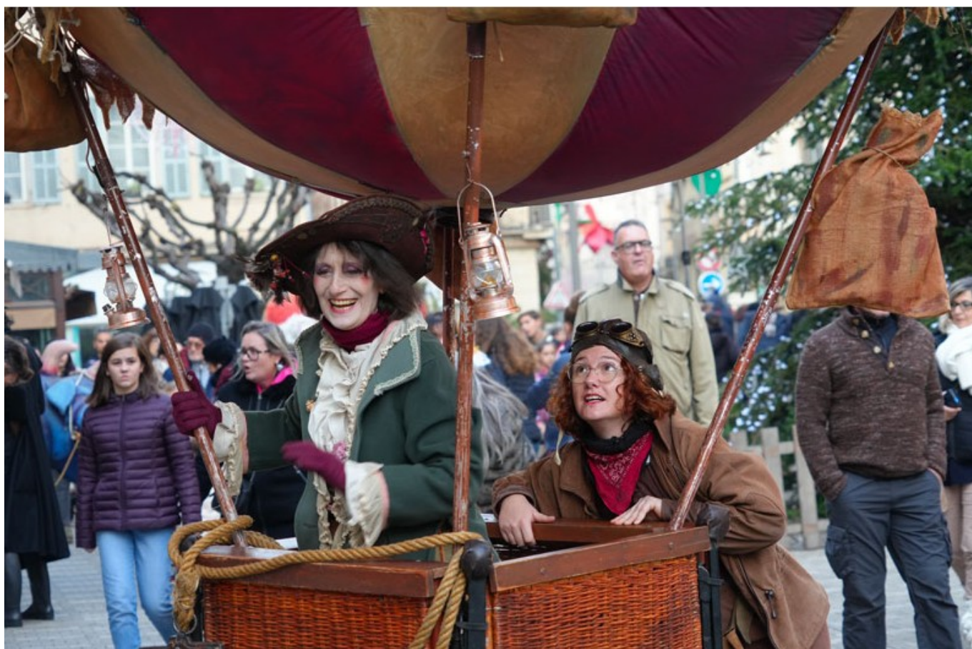
Déambulations dans la rue, Les filles de l'air

La fréquentation des spectacles au chaud des 'Noëls Insolites 2024' a été globalement très élevée. Plusieurs représentations, comme celles de « La renne de Noël » ou « Debout là-dedans », « Léonie en hiver » « Kéto ou la recherche du silence », ont affiché complet, atteignant 100 % de leur capacité. Les autres spectacles ont également connu un succès significatif, avec des taux de remplissage variant entre 65,5 % et 99,5 %. La diversité des spectacles et l'organisation bien répartie sur plusieurs jours ont contribué à cet engouement, confirmant l'attractivité de cet événement pendant les fêtes.