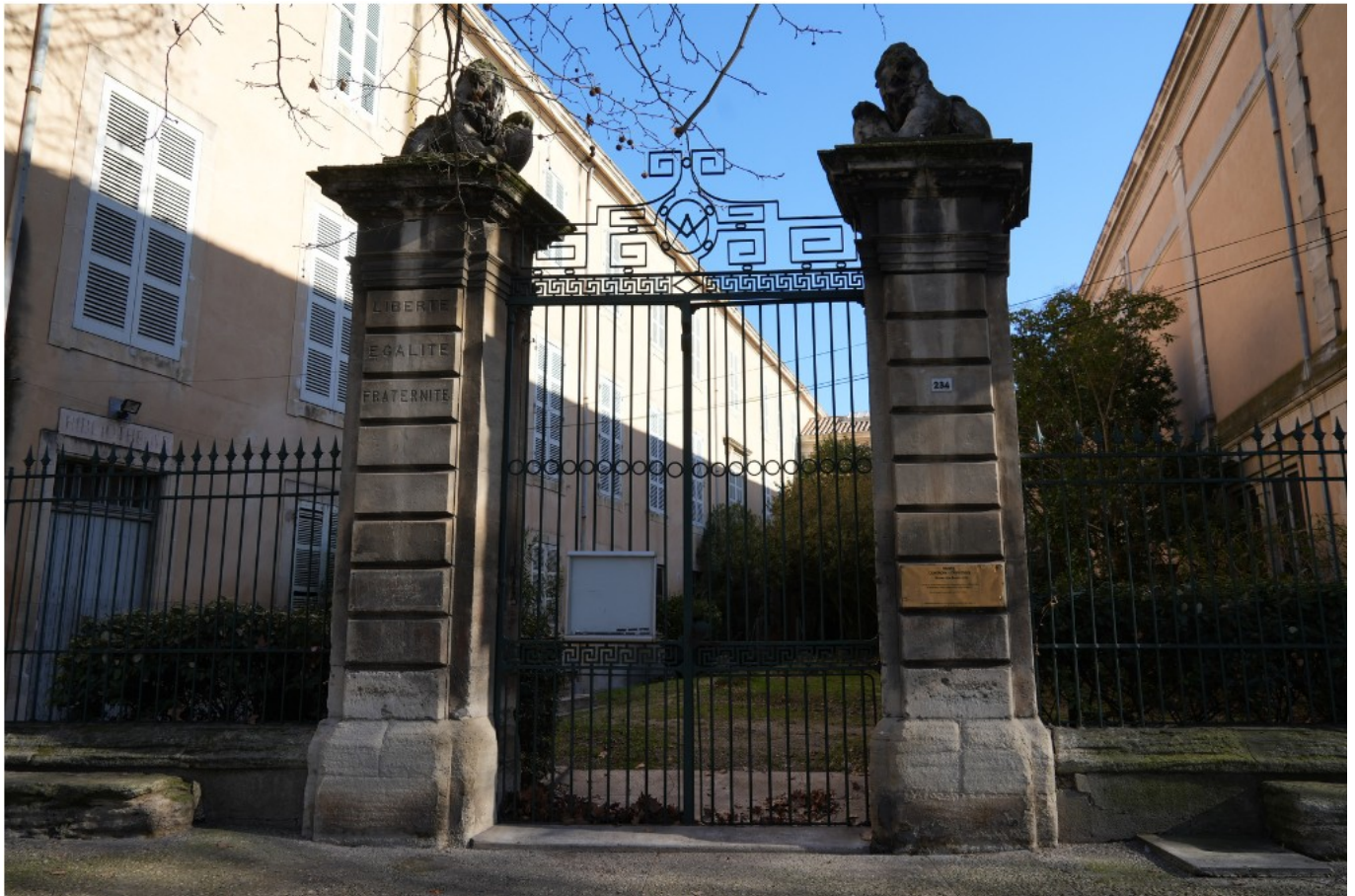
Portail de l'Hôtel d'Allemand

Réunion publique. Samedi 22 février. 10h, Hôtel d'Allemand, 234, boulevard Albin Durand, à Carpentras.