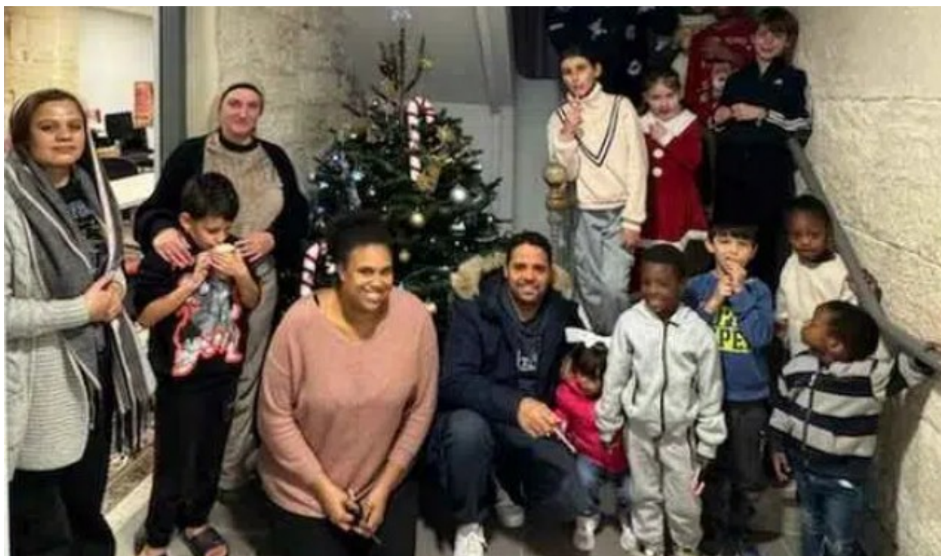
Noël 2024 à la résidence des Remparts à Avignon

Association située à Avignon, Habitat et Humanisme Vaucluse a été créée en 2015. Forte de ses 54 bénévoles et 5 salariées, elle dispose d'une cinquantaine de logements acquis en propre ou confiés par des propriétaires solidaires, afin de loger les personnes en difficulté. La structure gère et anime un habitat collectif destinés à des personnes d'âges variés, toutes isolées et avec de faibles ressources. Un des logements est réservé à des femmes victimes de violence conjugale. En 2025, elle a plusieurs d'habitats collectifs à Orange, Entraigues-sur-la-Sorgue et Carpentras.