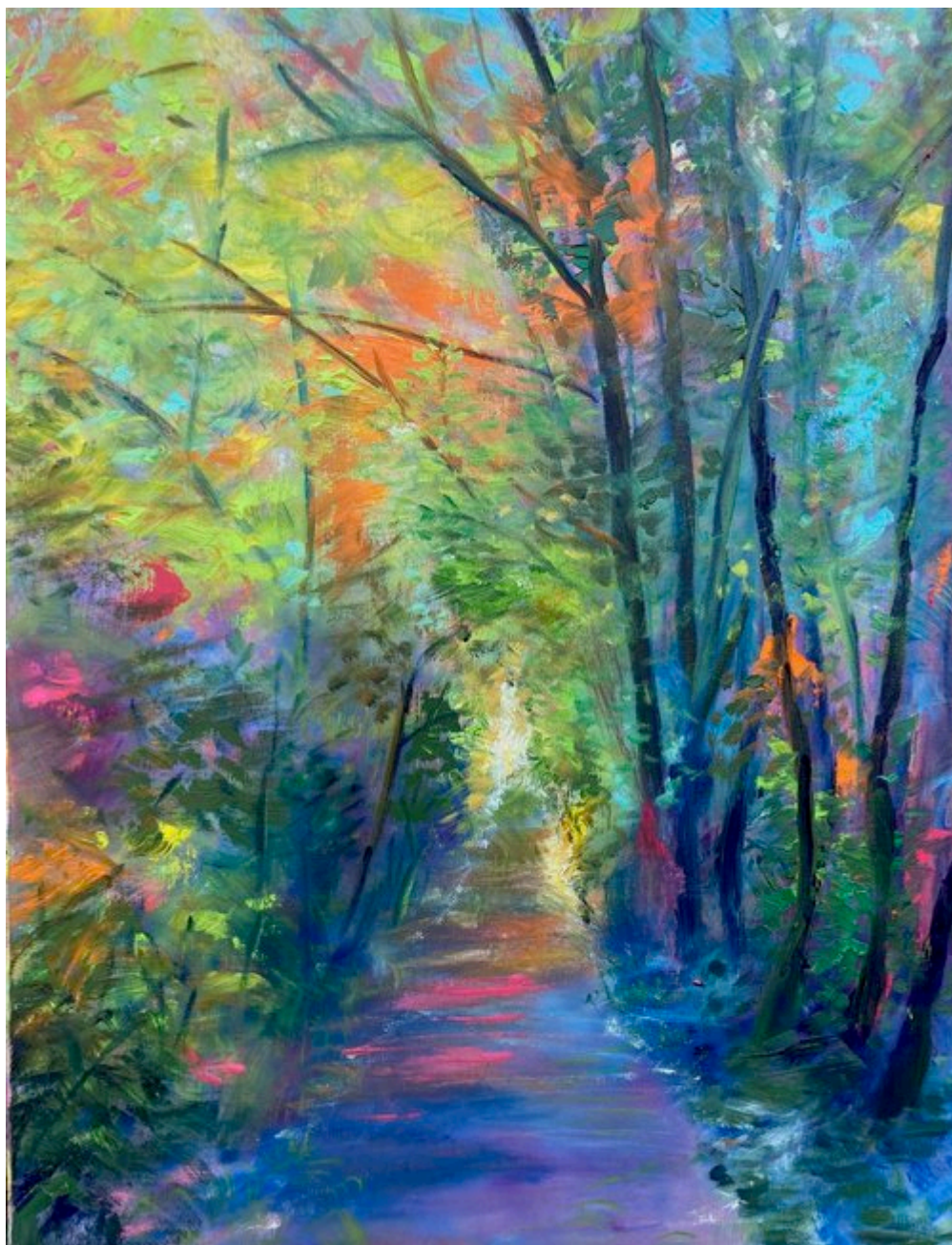
L'ETE « série les saisons » huile sur toile de lin 61 x 46.

Chapelle du Collège.21, rue du Collège, Carpentras.