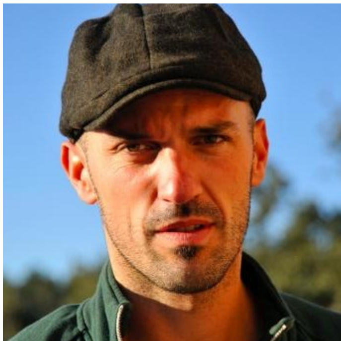
Olivier Dubuquoy, réalisateur du documentaire « Irréductibles »