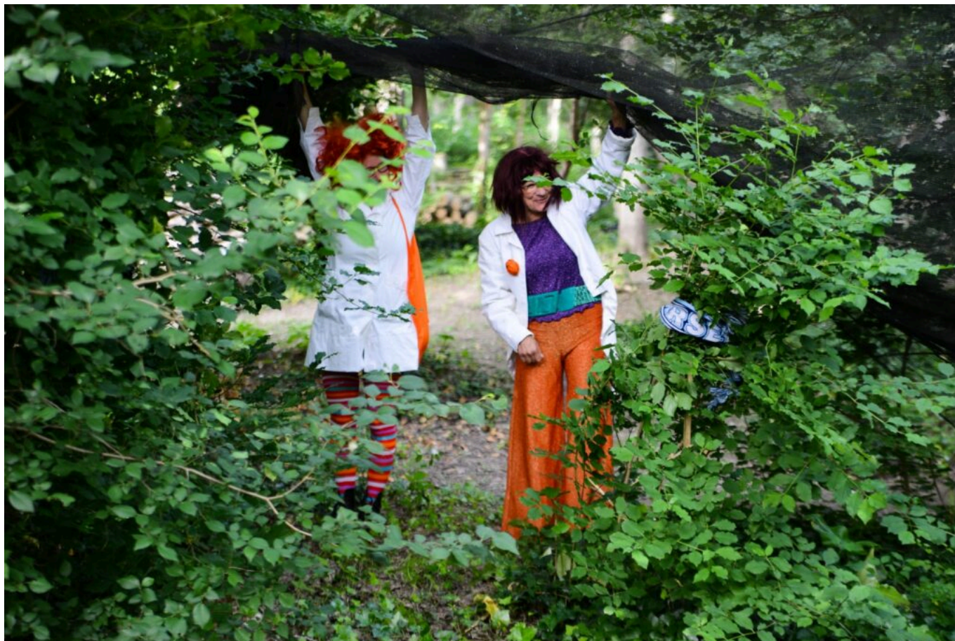
Les Fêlées du Tronc