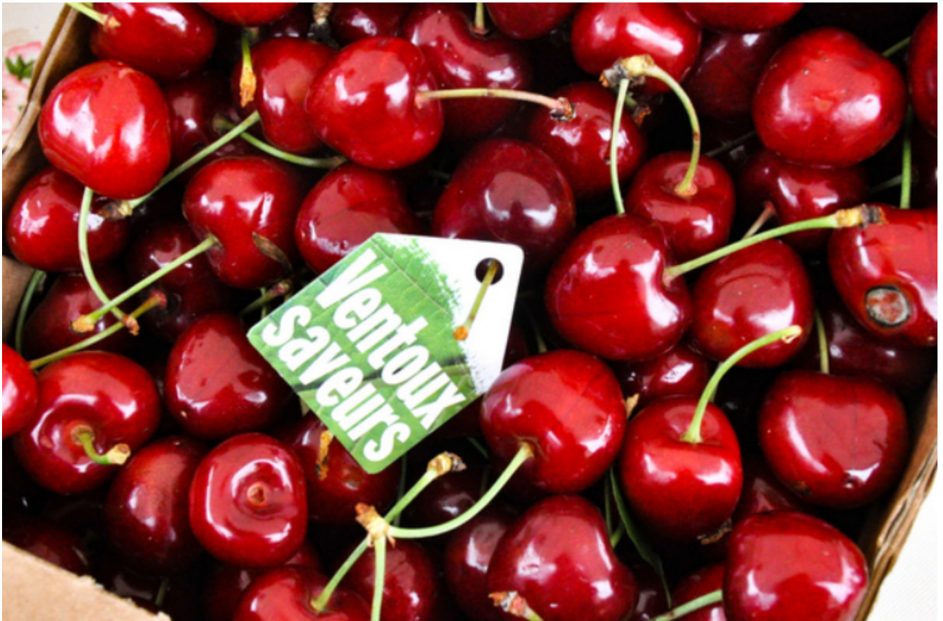
Cerises du Ventoux