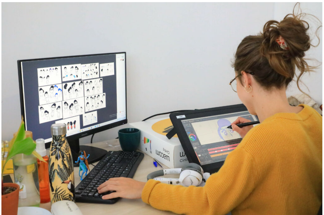
Les artistes réalisent la mise en mouvement des personnages

Avec cette installation, l'objectif des deux créateurs et de leur équipe, composée d'une quinzaine de personnes, est de produire leurs propres films, séries, courts et longs-métrages. Pour l'instant, le studio finalise son premier projet qui consiste à assurer une partie de l'animation du « Collège noir ». Composée de six épisodes de 15 minutes, la diffusion de cette série, adaptée de la BD éponyme d'Ulysse Malassagne, est prévue pour octobre sur la plateforme de streaming ADN , puis sur Slash (France Télévision).